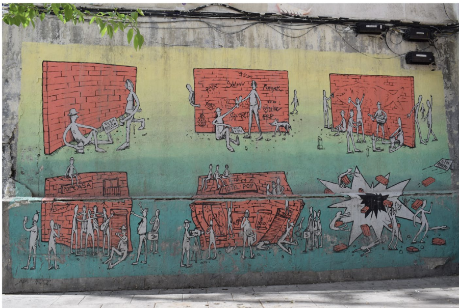
Figura 6. Grafiti alusivo a los muros. (Grafiti 4)

Esta intervención fue motivo de varias notas periodísticas que recuperan y referencian procesos de protesta y resistencia asociados con la gentrificación, a partir de la imposición de una estética que califica al barrio como «el más cool del mundo», alentando el uso del territorio por parte del turismo en detrimento de sus habitantes, a quienes les impacta de manera negativa, por ejemplo, en el aumento de las rentas. Cabe destacar que el reconocimiento de Lavapiés como el «barrio más cool» fue realizado por la reconocida revista británica Time out 5 en la que Lavapiés se destaca antes que nada por «su colorido». Al respecto una nota del diario El País , escrita por Begoña Gómez Urzaiz 6 , se pregunta si el street art gentrifica, al hacer referencia a la variada oferta de alojamiento a través de Airbnb y de «experiencias» entre las que se incluye el tour grafitero con guías que informan sobre el arte urbano e invitan a terminar el recorrido plasmando un propio stencil en una pared.