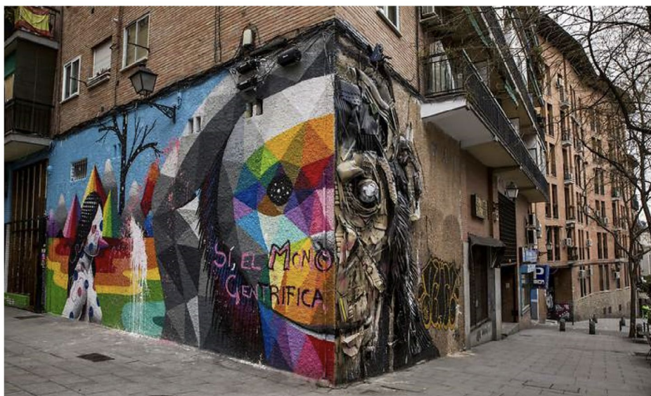
Figura 5. Mural del simio (Grafiti 3)

Esta imagen se ubica sobre el frente de un edificio en la esquina de las calles Embajadores y Travesía de Cabestros. La obra fue realizada en 2019 por dos artistas que trabajaron de manera conjunta, creando dos perfiles diferentes del mono representado. Si bien la obra no se encuentra firmada, uno de los perfiles corresponde a un reconocido y prestigioso artista español: Okuda San Miguel, cuyo estilo se caracteriza por la creación de grafitis geométricos y símbolos cargados de colores que resultan bien identificables y se incluyen dentro del movimiento llamado surrealismo pop. El otro perfil de la obra corresponde al artista portugués, Artur Bordalo, con sus intervenciones en relieve y en materiales reciclados.