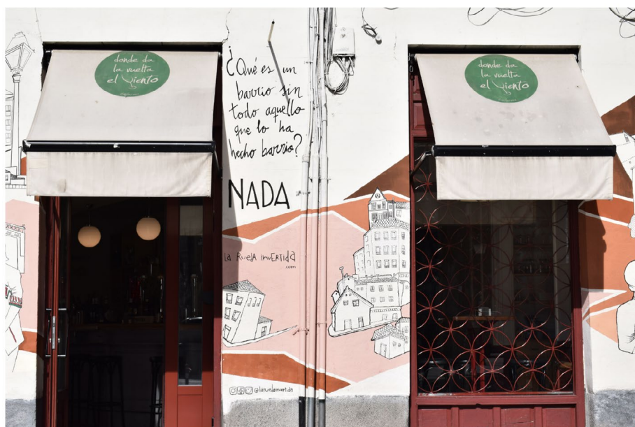
Figura 3. Grafiti Identidad Flotante (Grafiti 2)

En este marco, la frase «Luchando por la VISA», que aparece en el grafiti analizado y hace alusión a los papeles de residencia, es alterada con una intervención que modifica la letra «S» por la «D» y cambia el sentido de la frase, al ser vinculada con la lucha de los inmigrantes por la propia «VIDA» o por sobrevivir. En ese mensaje se entrecruzan sentidos sobre las políticas de control y vigilancia que operan sobre la «ilegalidad» de los pobladores africanos y, al mismo tiempo, su situación de desempleo que los ubica entre los grupos extranjeros más golpeados (Observatorio Permanente de Inmigración [OPI], 2010), y con pocos recursos para acceder a una vivienda y a otros servicios sociales básicos como la sanidad y la educación.