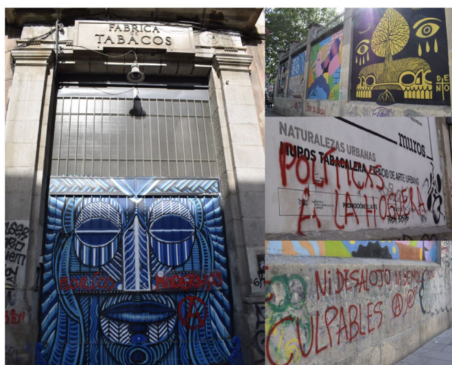
Figura 7. Conjunto de 4 grafitis de la Tabacalera. (Grafitis 5)

El final es el edificio y su pared destruidos. Una imagen que muestra la caída de los ladrillos sobre las personas. Es decir, una imagen que representa el poder de aquellos que tienen el capital económico y político por sobre los intereses e identidades barriales, y que promueven una explosión inmobiliaria del barrio sin reparar en los problemas que derivan de la gentrificación.