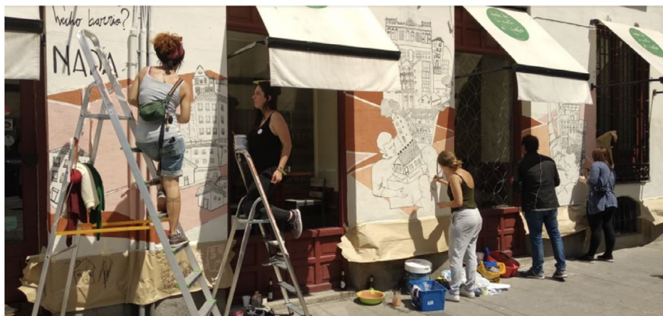
Figura 4. Colectivo la Rueda pintando el mural en el Festival

Nota. Tomado del Diario El País (21 de mayo de 2018).