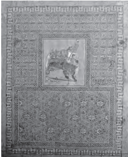
Mosaico del triclinium de la Villa del Mitra (Siglo III d.C.).

histórico ha dejado sus huellas en el barrio de la Villa.