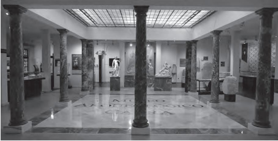
Patio de columnas del Museo Arqueológico Municipal.