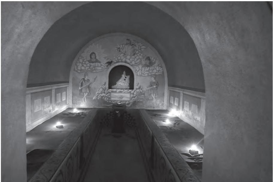
Reproducción del templo de culto al dios Mitra.

DELGADO, M.R. y VERA, J.C. (1996): "Estudio y revisión cronológica de los yacimientos de "La Fuente del Río" y "La Veleña" (Cabra): A propósito del paso del III al IIº milenio a.C. en el S.E. de Córdoba", Antiquitas , 7, pp. 35-44.