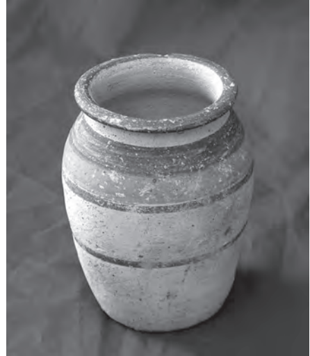
Vaso decorado del Cerro de la Merced (época ibérica).

Una inscripción de carácter verdaderamente excepcional es la que aparece en un pedestal de "mármol rojo de Cabra", que debió de estar situada en un lugar destacado del foro de Igabrum , dejando constancia que