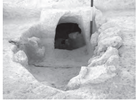
Tumba hipogea en el yacimiento de La Beleña (IV milenio a.C.).

de la arqueológica de Cabra se centran en algunos de sus principales hitos, lo que primero fueron hallazgos aislados de diversos objetos y simples descripciones de lugares son en la actualidad excavaciones y estudios realizadas por equipos científicos de distintas universidades: