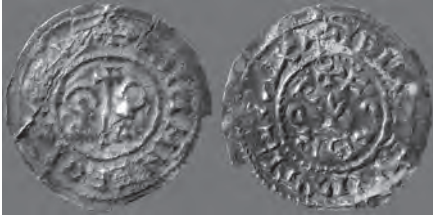
Triente de Egabro (época visigoda).

do en torno a la ciudad y servía para controlar los caminos y dar aviso en caso de necesidad encendiendo hogueras en su azotea.