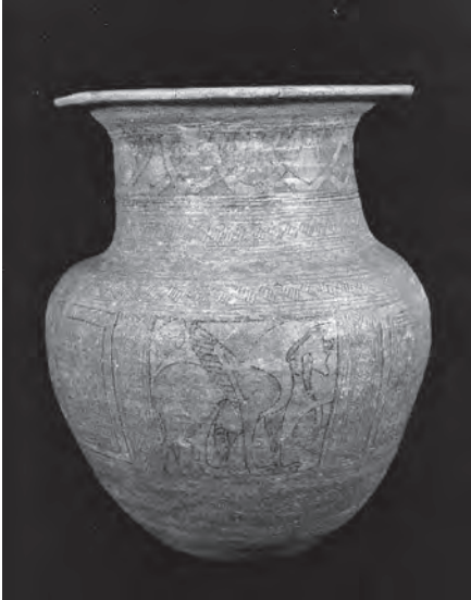
Urna funeraria (época orientalizante).