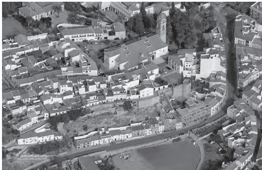
Vista aérea del barrio del Villa. Muralla de la calle Ana de la Rosa.