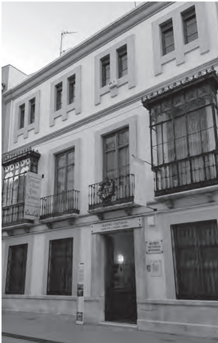
Fachada del Museo Adolfo Lozano Sidro.