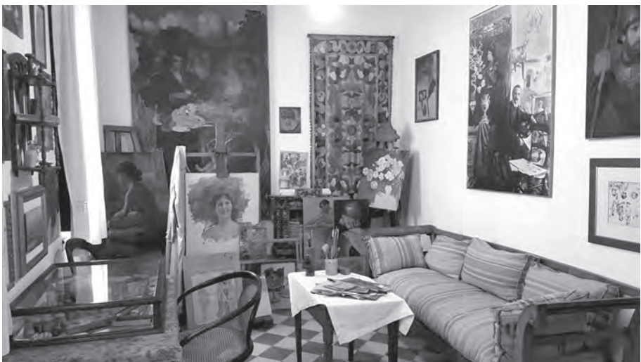
Estudio del pintor en el Museo Lozano Sidro.