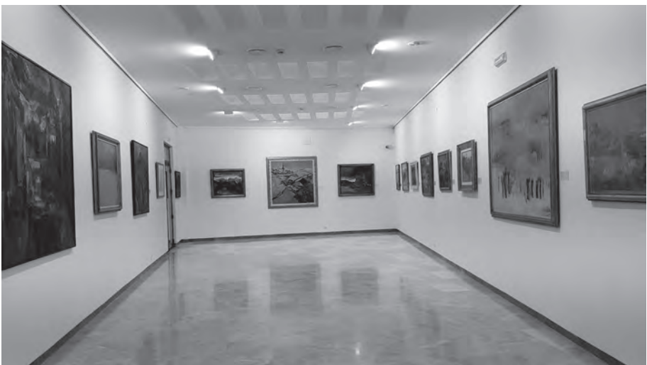
Sala II del Centro de Arte Antonio Povedano.