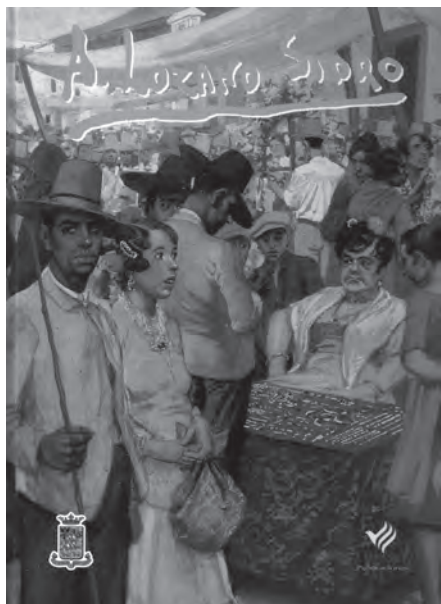
Portada del Catálogo General de Adolfo Lozano Sidro.

La obra, bajo el título “ADOLFO LOZANO SIDRO: VIDA, OBRA Y CATÁLOGO GENERAL” fue presentada el 16 de diciembre de 2000 con asistencia de los autores, de representantes de las entidades que financiaron la edición y de numeroso público. En un total de 320 páginas (tamaño 29,5 x 22,5) la obra presenta los tres estudios citados con extensión total de 96 páginas, reproducción de la imagen en formato catálogo, de 1344 obras de Lozano Sidro (el total de obra conocida hasta aquel momento), y reproducción de una selección de 100 obras a todo color y formato página.