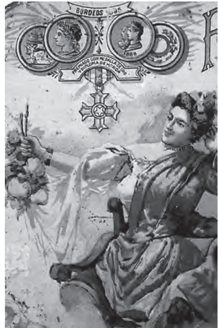
Fig. 10.- "Exposición de Burdeos" Premio membrillo R. Rivas.

completa la muestra, una serie una serie de materiales e instrumentos relacionados con el cultivo, transporte y posterior elaboración industrial del "dulce de membrillo". Para una mejor visión del proceso de fabricación ayuda a ello una maqueta reconstrucción de una de las norias del Genil, un carro para el transporte y la maqueta de una fábrica de membrillo "La Góndola" en la cual se muestra al visitante el proceso completo en la elaboración de la "carne de membrillo". Con la creación de esta sección pretendemos conservar, documentar y recopilar elementos que forman parte de nuestro Patrimonio más reciente, pero; no por ello, más importante y como no digno de conocer y preservar.