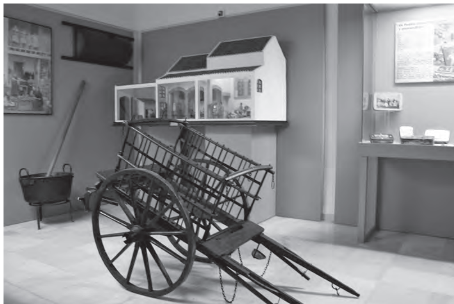
Fig. 8.- Panorámica Sala IV "Industria del membrillo".

una burguesía empresarial y de un proletariado activo en toda la etapa.