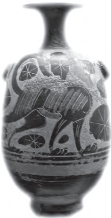
Fig. 3.- Cerámica griega “Los Castellares”.

La siguiente vitrina de la Sala II ofrece materiales del Bronce Final, última manifestación de la Edad del Bronce, que hunde sus raíces en etapas anteriores y muestra relaciones y aportes de otras zonas de la Península Ibérica y del Mediterráneo Oriental, muestra de ello son diversos fragmentos de grandes recipientes de cerámica púnica de “asas geminadas” aparecidos en “Las Mestas” o una cerámica corintia del siglo IV a.C. ( Fig. 3 ) aparecida en “Los Castellares”. Esta simbiosis de elementos autóctonos y otros llega-