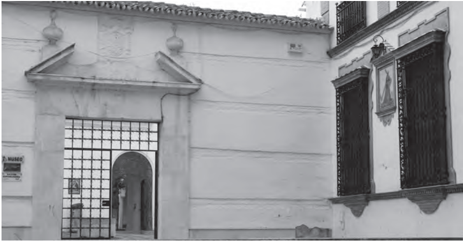
Fig. 1. Edificio del Museo "Convento de La Victoria".

materia, localización, cronología. En 1995 se llevó a cabo la informatización de los fondos con el programa LOTUS-APPROACH.