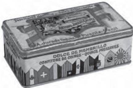
Fig. 9.- Envase de membrillo "La Andaluza" 1929.

ción de 1909 en Londres o Burdeos, "La Fama" premiada en la Exp. U. de Barcelona y premiada con Cruz y Diploma en la de Burdeos. Ha habido ocasiones en las que se crea un modelo de envase para una conmemoración especial como fue el caso de membrillo "La Andaluza" (Fig. 9) para la Exposición Iberoamericana de 1929 en Sevilla (ESOJO, 2010: 180).