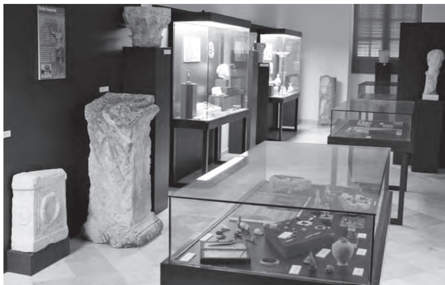
Fig. 4.- Sala II Mundo romano "ara consagrada a Augusto".

Las tres vitrinas de mesa están destinadas a exponer diversos objetos de metal y vidrio relacionados con el mundo del varón, de la mujer y de la infancia. En la primera se muestran armas (puntas de flecha, lanzas...), instrumental médico, y