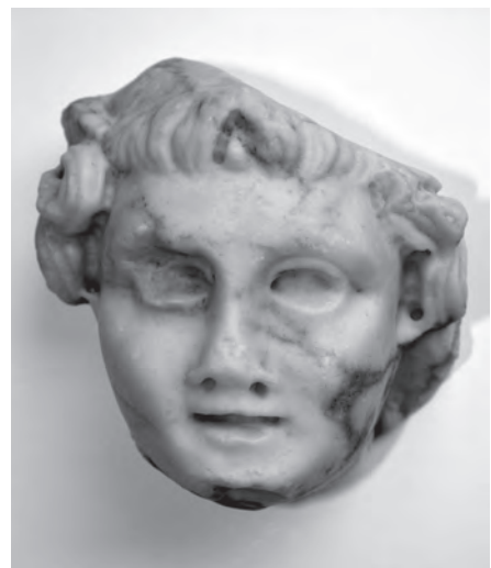
Fig. 6.- Retrato en mármol de Hermes.

El registro arqueológico en la zona muestra la presencia visigoda en yacimientos como: El Carril, Los Castellares, Fuente Álamo o Los Arroyos. En todos ellos la ocupación humana viene precedida de la de época romana (ESOJO, 1998: 209). En la Sala II del museo y pertenecientes a este periodo se muestran una serie de elementos de ajuares funerarios: cerámicas, hebillas y adornos de bronce procedentes del importante yacimiento de Los Castellares, donde se localiza una