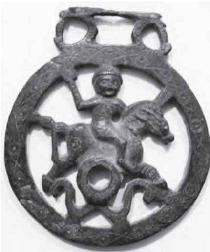
Fig. 5.- Bronce romano: cama de freno.

una variada muestra de arreos de caballo “camas de freno” de bronce ( Fig. 5 ) de época bajo imperial (ESOJO, 1996). Se completa la muestra con una colección numismática de bronce y plata de las etapas republicana e imperial (GIL y GALEANO, 1998). En la segunda vitrina de mesa se muestran diversos objetos de metal, vidrio... relacionados con el mundo de la mujer como: objetos de adorno personal (pendientes, anillos, fíbulas...), exvotos (amuletos, falos), pesas de telar, ungüentarios, espejo de plomo, jarrita de plata etc. La tercera vitrina; dedicada a la infancia y muestra: fichas de juego, exvotos (amuletos, falos...), punzones para escribir y elementos de adorno personal (anillos, fíbulas...).