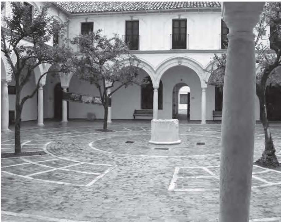
Fig. 2. Brocal de pozo romano: claustro de “La Victoria”.

- 1999 Trabajos de limpieza y acondicionamiento en la villa romana de Fuente Álamo.