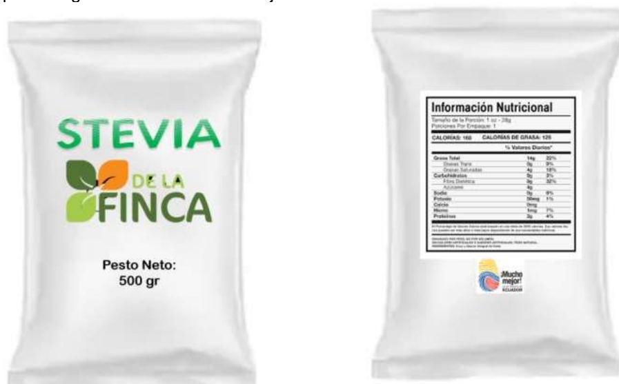
Figura 2. Presentación del producto

Para la comercialización del producto se utilizarán empaques de plástico, cuya capacidad será de 500 gramos del edulcorante de stevia, y donde se encontrará el etiquetado del producto, con la descripción respectiva de sus ingredientes, marca de la Hacienda La Finca, peso y toda la descripción previamente establecida. Vale destacar que la información nutricional llevará la leyenda que indique: 0% en calorías, 0% en grasa total y 0% en carbohidratos y proteínas, ya que su ingrediente esencial es hoja de stevia verde.