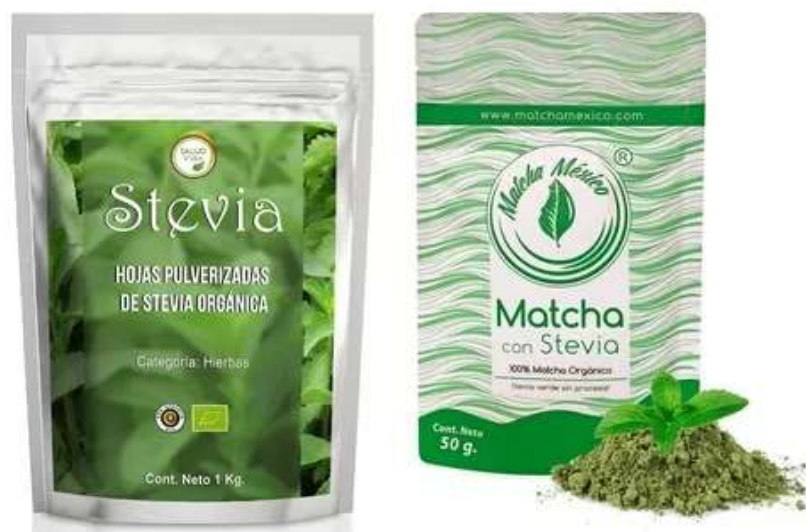
Figura 4. Marcas Competidoras

Para la exportación del producto, se considera el peso bruto que posee una caja, la misma que debe ser estibada por al menos dos personas. En cada caja habrá 12 empaques de 500 gramos, de manera que con los cálculos estimados se enviarían al menos 1.100 cajas que en su interior posean 12 unidades de 500 gramos, lo que equivale a un total de 13.200 empaques de edulcorante de stevia que, al presentar un peso total de 500 gramos, se obtendría un peso total de 6.600 kg (6.6 toneladas). A continuación se presentan los cálculos realizados, conforme a la medida de un contenedor de 20 pies.