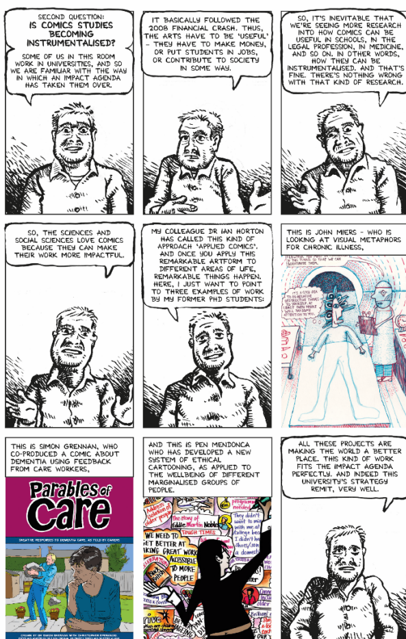
Fig. 4. Homenaje a The Harvey Pekar Name Story de Roger Crumb y Harvey Pekar. Cortesía de John Miers y Roger Sabin

La segunda pregunta [fig. 4] tiene como trasfondo la crisis económica de 2008 y la instrumentalización de las artes que, de acuerdo a parámetros utilitaristas, debían ser «útiles», es decir, generar financiación para proyectos y contribuir a la sociedad de alguna manera. En este sentido las ciencias (sociales) ven en el cómic la posibilidad de que sus investigaciones tengan mayor impacto. Incluso algunas de las líneas de trabajo más actuales como la medicina gráfica encajan perfectamente dentro de la «utilidad» sin desmerecer el rigor y avanzar en los estudios de cómic. Pero un enfoque demasiado centrado en las aplicaciones de cómic (o Applied Comics) podría desestimar muchas otras líneas de trabajo que también hacen avanzar el campo pero que tienen, a priori , menor «impacto».