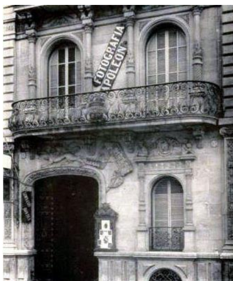
Figura 6. 1985. Entrada del nuevo estudio de «Napoleón», en la rambla de Santa Mónica números 17-19 (hoy 18).