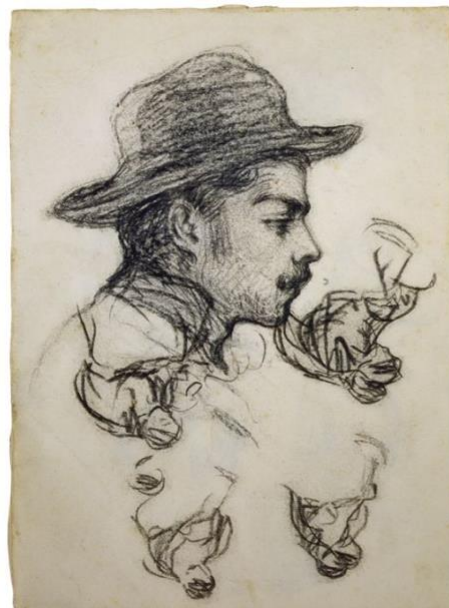
Figura.1. Pablo Picasso, 1896. Autorretrato (Museu Picasso, Barcelona). (Izda). Figura.2. Pablo Picasso, 1898. Cabeza de Pellarès (Museu Picasso, Barcelona).

Don José, tenía motivos de peso para desear un cambio vital, nunca llegó a adaptarse completamente a la Coruña y su hija Conchita había muerto prematuramente en enero del mismo año en que se produjo el traslado a Barcelona. Cuando Pablo Picasso llegó a la Ciudad Condal contaba con 14 años. Allí realizó el examen de ingreso en la misma institución en la que trabajaría su padre, la Escuela de Bellas Artes de la Llotja, donde permaneció estudiando hasta 1897. En la Escuela de Bellas Artes de Barcelona conoció al estudiante catalán Manuel Pellarès i Grau, con el que rápidamente entablaría amistad. A pesar de la diferencia de edad que existía entre ambos, Pellarès era varios años mayor que Picasso, juntos compartirían vivencias tanto en la Escuela de Bellas Artes como en las calles de Barcelona, en las cuales se aglutinaban todo tipo de actividades de ocio, así como nuevos acontecimientos dignos de la ciudad moderna en la que se estaba transformando.