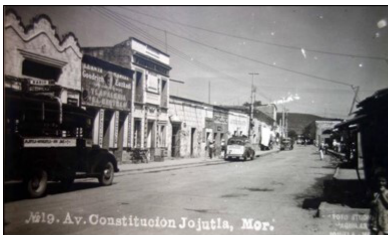
Imagen 3. Avenida Constitución del 57 en el centro de la ciudad de Jojutla. 38

[...] en la calle Real empiezan a construirse las primeras casas de los primeros grandes ricos de Jojutla... y alrededor de la plaza principal empieza a cobrar importancia el centro actual de Jojutla, por eso hemos dicho que Jojutla es una ciudad con dos corazones, en el corazón viejo de su origen de San Miguel de Jojutla en la alameda, y el corazón que se forma a partir del siglo XVII en el actual centro de la ciudad [...]. 37