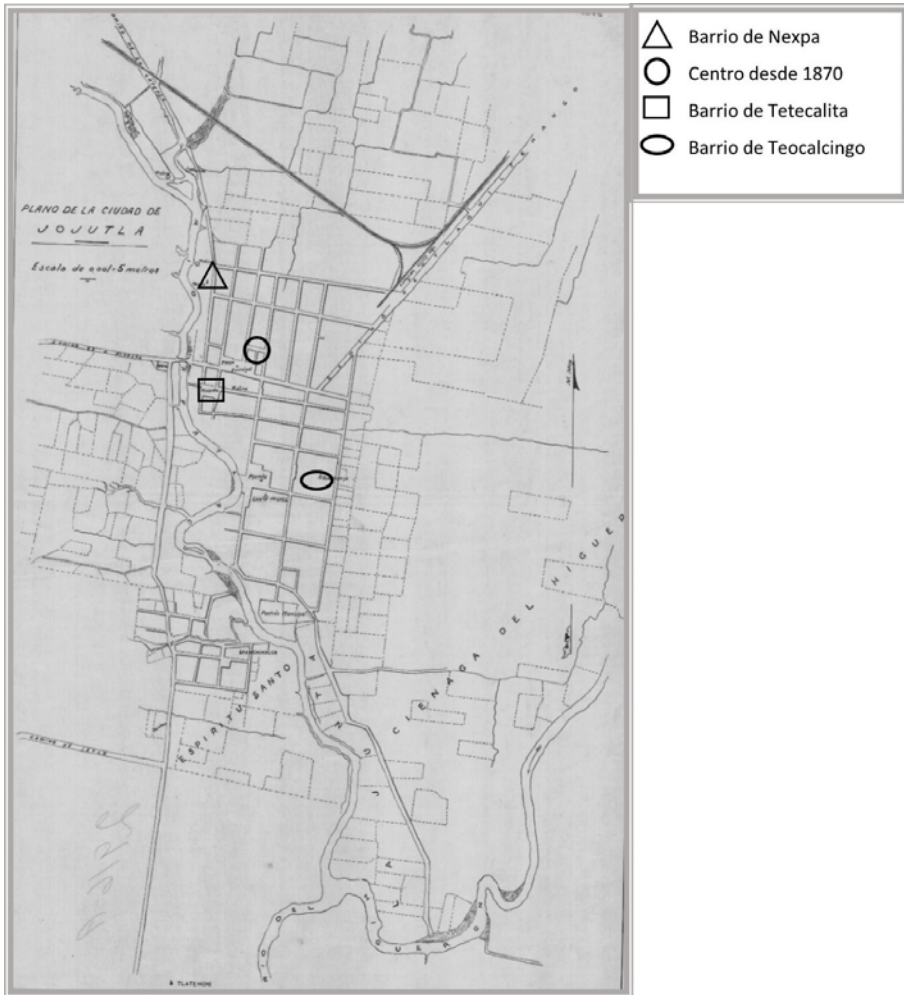
Imagen 2. Distribución de los barrios en el centro en un plano posterior de Jojutla (1890-1920). 21

En este sentido, el proceso de conquista y colonización fue un paso determinante en los cambios que se darían en el territorio en las siguientes centurias. Allí, se da paso a una ruptura en la interrelación dialéctica, material y simbólica, entre naturaleza y sociedad, así como la fragmentación de espacios y propiedades comunes. De esta manera, se propagó una explotación intensiva del entorno natural y se fueron desplazando paulatinamente formas tradicionales de uso de la tierra, lo cual marcó la senda para métodos de producción destructivos y transformaciones en la ocupación del territorio, actividades agrícolas e interacción con las riquezas naturales.