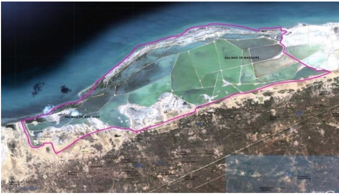
Figura 1. Área de estudio distrito de manejo integrado Musichi (Corpoquajira-Biocolombia-CI, 2011).

La unidad de análisis en el territorio objeto de estudio la conforman las rancherías que tienen alguna relación con el área del DMI, ya sea porque derivan su sustento, son dueñas del territorio o mantienen un vínculo ancestral con ella, fueron habitadas o usufructuadas por sus antepasados, como Neima, Pato Rojo, con la particularidad de la Tuna sin residencia actual de los Wayuu; sin embargo, los descendientes de los primeros habitantes, están decididos a retornar a estas tierras que por derecho les pertenece.