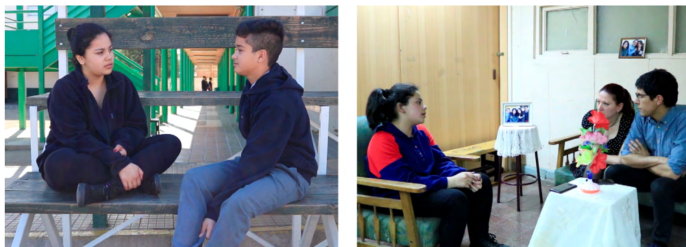
Fotograma 3. Fotogramas del cortometraje Es mi decisión.

pueden estar ocurriendo delante de la mirada docente e, incluso, familiar, pero que permanecen ocultas. El