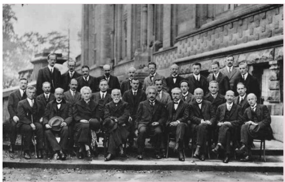
Fig. 5 – Participantes da 5ª Conferência de 1927.

A personagem mulher da história da CT que, frequentemente, recebe algum destaque nas coleções de LD é Marie Curie (1867-1934), aparecendo ao menos uma vez em grande parte das coleções, exceto na J, que não traz nenhuma cientista mulher da história da CT, seja de forma individual ou mista. Referente a essa cientista, doze imagens a representam, sendo que em uma não é citado seu nome, embora apareça como a única mulher entre 28 homens (Fig. 5).