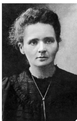
Fig. 6 – Retrato da cientista Marie Curie.