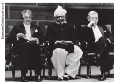
Fig. 1 – Cientistas Glashow, Salam e Weinberg, ganhadores do Prêmio Nobel de Física em 1979.

consideramos desviar do padrão de cor estabelecido pelos LD (Fig. 1 e Fig. 2), apresentando personagens que aparentam ser de cor preta, parda e amarela relacionadas à CT.