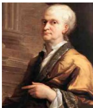
Fig. 3 – Isaac Newton com expressão facial que remete às características masculinas.

expressão facial raramente presente em pessoas desse ramo, demonstradas nas Fig. 1 e 2. A seriedade e a frieza, com possíveis expressões que indicam braveza ou nenhuma demonstração de sentimento estão presentes de forma expressiva em imagens desta categoria, ademais, algumas parecem retratar pessoas com preocupação ou tristeza. A exemplo trazemos a Fig. 3.