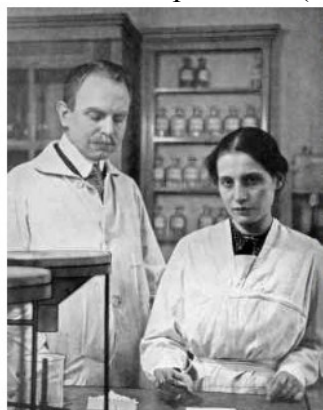
Figura 10.15 Retrato de Otto Hahn (1879-1968) e Lise Meitner (1878-1968).

em maior número. Mulher no papel de auxiliar do homem (Fig. 7) ou no que parecia indicar serem cobaias de uma experiência (Fig. 8) constam em duas imagens.