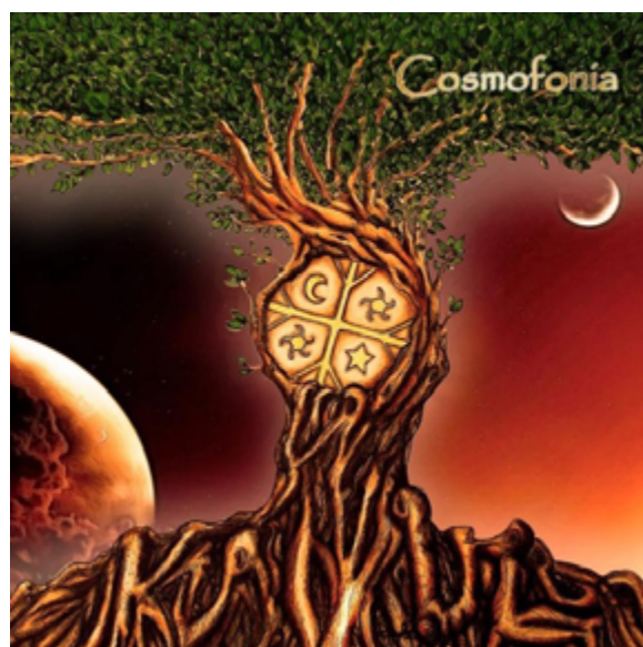
Ilustración 1: Carátula de “Cosmofonía” (2012), de Kaikül.

Kaikül es una agrupación de la comuna de Puerto Montt, Chile, que inicia su actividad musical el año 2012. Se caracteriza por un estilo cercano al folk , e incorpora elementos del rock progresivo y algunos aspectos organológicos y discursivos asociados a la cultura mapuche. La canción que abordaremos se denomina Uñumche . 3 Pertenece al disco “Cosmofonía” (2012), el cual posee diversos elementos a nivel iconográfico que permiten asociar el concepto de “cosmofonía” con la cultura tradicional. Desde esta perspectiva, es posible identificar un vínculo entre las alusiones a la cultura de dicho pueblo originario, y la naturaleza como un elemento que configura símbolos de identidad étnica (Parsons, 1975: 65). En tal sentido, esta premisa es observada tanto a nivel visual como también musical. Sobre lo primero, es posible identificar cuestiones interesantes en la carátula de “Cosmofonía”: