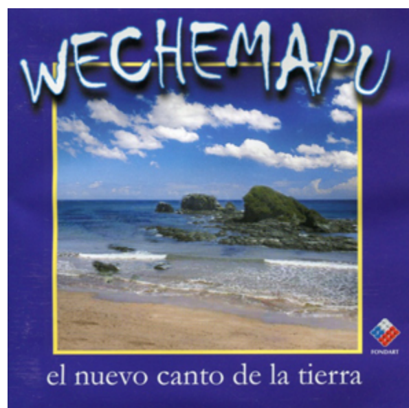
Ilustración 2: Carátula de “El nuevo canto de la tierra” (2005), de Wechemapu .

Yafkun Pitiu 15 pertenece al disco “El nuevo canto de la tierra”, editado y publicado en 2005. Algunas canciones pertenecientes a este álbum utilizan ritmos derivados de danzas tradicionales de la región, como la sajuria y la guaracha . En tal sentido, en algunas de sus composiciones se encuentran presentes la lengua mapuche, ritmos asociados a la tradición mapuche e instrumentos como la trutruka , el trompe , el kultrun y la pifilka . Al igual que en el caso de Kaikül , los aspectos gráficos del disco también remiten a la naturaleza.