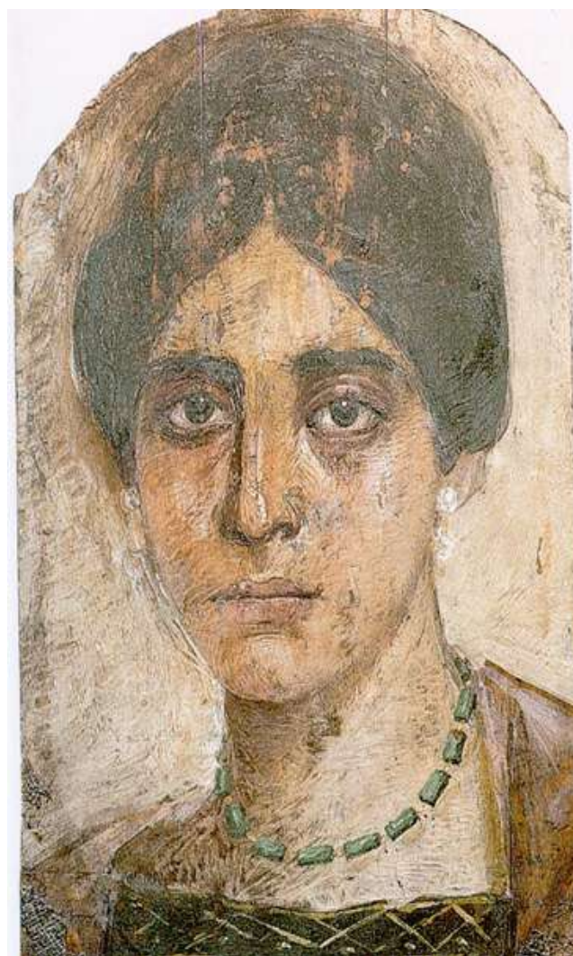
Imagen 3. Anónimo, (siglo II D.C). El Fayum .

No es posible penetrar en el misterio de la mirada que nos lanza la mujer anónima de El Fayum (Imagen 3) únicamente desde aspectos históricos y conceptuales, ni siquiera desde los exclusivamente estéticos. Más allá incluso de la contextualización iconológica que nos remite a estudios de carácter cultural, en la obra emerge una apelación personal, de persona a persona en lo existencial. Esos ojos negros, lánguidos pero expectantes, nos confirman que, aunque hay numerosos detalles de la retratada que desconocemos, nos llevan a intuir, por pura empatía con su finalidad funeraria, que su sentido es encontrarse con la eternidad. Nos emociona contemplar esos ojos enfrentados a la muerte con la serena elegancia del que asume lo inevitable, más allá de sus creencias sobre el Hades. Ni rito, ni impostura; su rostro no puede exhibir mayor sinceridad, la que nos exige a los que la contemplamos cuando entendemos que su mirada se nos clava para formularnos la pregunta sobre nuestro propio destino. Como propone Bailly (2001) en referencia a todo este género funerario romano que fusionaba sincréticamente creencias romanas y egipcias en los primeros siglos de nuestra era, durante unos instantes, los espectadores