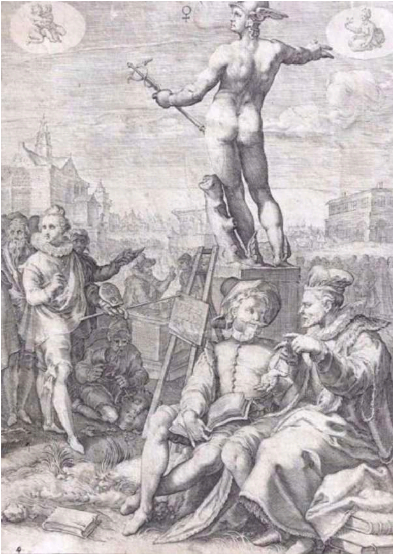
Imagen 2. Saenredan, Goltius (1597). Mercurio.

imagen ha sido profundamente analizado por autores de referencia en el análisis histórico de la imagen, como Elkins y el carácter alquímico de la imagen (2000), Freedberg y el poder mágico de la imagen (2009) o Belting y el aspecto sagrado de la imagen (2009). Todos ellos parten de una perspectiva antropológica para entender y analizar la imagen, pues, tal y como afirma Belting, de algún modo la imagen debería ser interpretada como un singular modo de existencia humana: