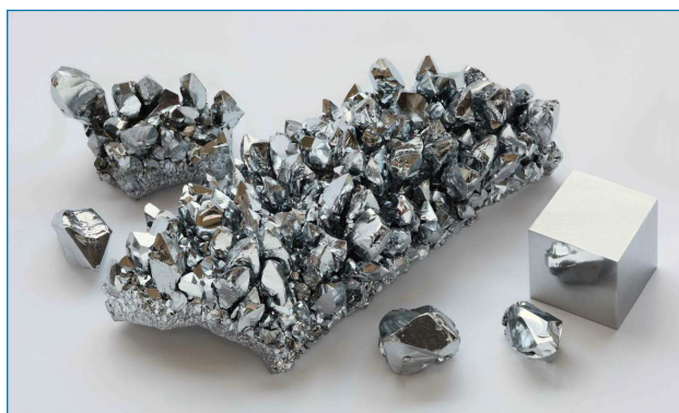
Figura 1. Cristales de cromo producidos por descomposición de yoduros de cromo (pureza 99,999 %) y cubo de cromo de 1 cm 3 de alta pureza (99,999 %) para su comparación [4]

Prácticamente todos los compuestos de cromo poseen color. Los cationes Cr 3+ y Cr 2+ , por ejemplo, forman compuestos de coordinación muy fácilmente con un amplio rango de colores. Así, el [Cr(H 2 O) 6 ] 3+ es violeta mientras que el CrCl 2 es azul. Este último compuesto, mediante adición de acetato, forma Cr 2 (OAc) 4 , de color rojo y que además presenta un enlace cuádruple Cr–Cr. [5] El CrF 4 es marrón y el óxido de Cr(IV) es negro, mientras que el inestable CrF 5 es un sólido rojo volátil. El CrO 3 , de color verde, se vuelve amarillo cuando se calienta en presencia de K 2 CO 3 y KNO 3 , por formación de K 2 CrO 4 . Por último, no nos podemos olvidar del precioso color naranja del K 2 Cr 2 O 7 , compuesto que todos hemos usado durante nuestros estudios de química. El cromo es también responsable del color de los rubíes (óxido de aluminio dopado con cromo), de los tonos rosados de los zafiros y del color verde de las esmeraldas. [6] Está claro entonces que Vauquelin no podría haber elegido mejor nombre para este elemento: el elemento del color .