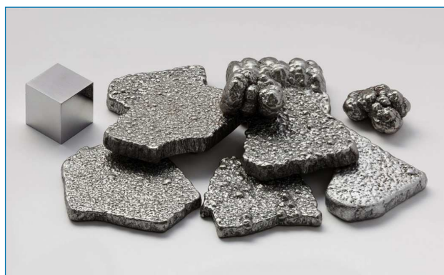
Figura 1. Hierro de alta pureza (más de 99,97 %) refinado electrolíticamente y un cubo de hierro de alta pureza de 1 cm de lado [4]

Además, el hierro es un elemento esencial para la vida. Se encuentra en prácticamente todos los organismos, lo cual se relaciona con su abundancia en la corteza terrestre y por lo tanto, con su disponibilidad durante la evolución. [5] La cantidad de hierro que contiene el cuerpo humano está alrededor de 4 gramos y se requiere de un aporte diario de entre 10 y 18 mg. Su deficiencia lleva al desarrollo de la anemia. La mayor parte de este hierro se localiza en el centro activo de proteínas con funciones claves para la vida. Por ello resulta un elemento fundamental en la estructura de la mioglobina, proteína encargada del almacenamiento de O 2 , y de la hemoglobina, proteína responsable del transporte de O 2 en la sangre dentro de los glóbulos rojos. Además, existen muchas otras enzimas involucradas en procesos de activación del oxígeno y en el transporte de electrones que también contienen hierro en su centro activo, como por ejemplo citocromo P450, citocromo c oxidasa, proteínas Fe-S, catalasas o peroxidasas. [5] Algunos de estos sistemas biológicos sirven de inspiración para el desarrollo de catalizadores sintéticos.