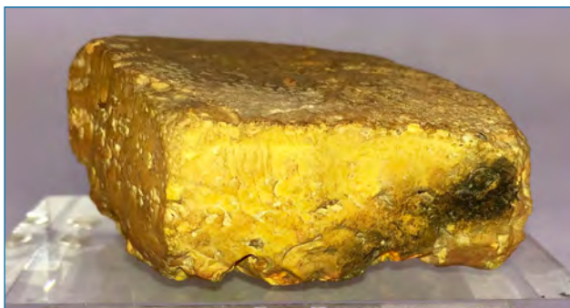
Figura 1. Fotografía de una muestra del mineral natural oropimente amarillo. Museo Geominero de Madrid

En la naturaleza, además del oropimente ( auripigmentum , pigmento dorado) (Figura 1) que se puede encontrar en las fumarolas de los volcanes y en fuentes hidrotermales templadas y que se puede formar como subproducto de descomposición de otros sulfuros como el rejalgar por acción de la luz solar, también podemos encontrarlo en forma nativa o en la arsenolita, As 4 O 6 , la arsenopirita, FeAsS, la enargita, Cu 3 AsS 4 , y otros minerales en conjunción con otros metales como Pb, Fe o Cu. [3] Aun así, la abundancia relativa de arsénico es pequeña (0,00021 %) siendo el 52º elemento en abundancia en la corteza terrestre. En España se encuentra en diversos yacimientos de los que destaca el de Guadalcanal (Sevilla) en el que se halla formando nódulos esferoides con plata nativa. En el método que se