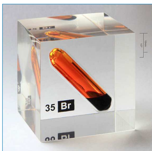
Figura 1. Vial de bromo líquido en equilibrio con su fase gas dentro de un recipiente de metacrilato [3]

La obtención del bromo implica la oxidación de los bromuros, su mena natural. Este proceso de obtención se puede realizar por las vías ordinarias: oxidación química en medio ácido (con MnO 2 , KMnO 4 ...) o bien por oxidación electroquímica. En la actualidad, se obtiene por oxidación de los bromuros con cloro, y el bromo líquido que se obtiene muy impuro, se destila fraccionadamente para obtenerlo como un líquido denso de color rojo parduzco (Figura 1). [3] El máximo productor de bromo en el mundo es Estados Unidos, cuyas salmueras de Arkansas contienen cerca de 5000 ppm y las de Míchigan poseen unas 2000 ppm. También es importante la producción del Mar Muerto, cuyas aguas tienen una concentración de cerca de 5000 ppm. El bromo se encuentra en todos los mares y lagunas