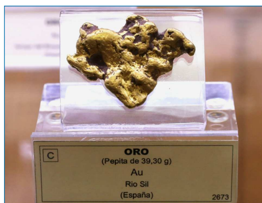
Figura 1. Pepita de oro del río Sil (Museo Geominero) [1]

Gold hath these Natures: Greatnesse of Weight; Closeness of Parts; Fixation; Pliantnesse, or softnesse; Immunitie from Rust; Colour or Tincture of Yellow. Therefore the Sure Way, (though most about), to make Gold, is to know the Causes of the Severall Natures before rehearsed, and the Axiomes concerning the same. For if a man can make a Metall, that hath all these Properties, Let men dispute, whether it be Gold, or no?