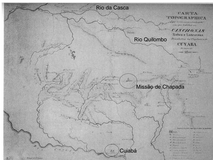
FONTE: Carta Topográfica das Serras, montanhas em que habitam as Cinchonas – Rubra e Lutescens descobertas na Capitania de Cuyabá no anno de 1800. Isa Adonias, 1993, p. 346 – Através deste mapa foi possível localizar alguns dos Engenhos às margens do Rio da Casca e Quilombo

poder molda-se na hierarquia senhorial, na posse de escravos e na hierarquia militar, pois os postos eram divididos entre estes senhores e os seus. Neste contexto, é importante notar a participação da imigração portuguesa na formação de uma sociedade que resiste e prospera, na adversidade da fronteira que se lhes apresentou, ainda em Portugal, como sendo o eldorado no novo «novo mundo». No minguar aurífero, transporta-os para uma atividade que os fixa nesta região, a maioria definitivamente, tornando-os os senhores desta terra.