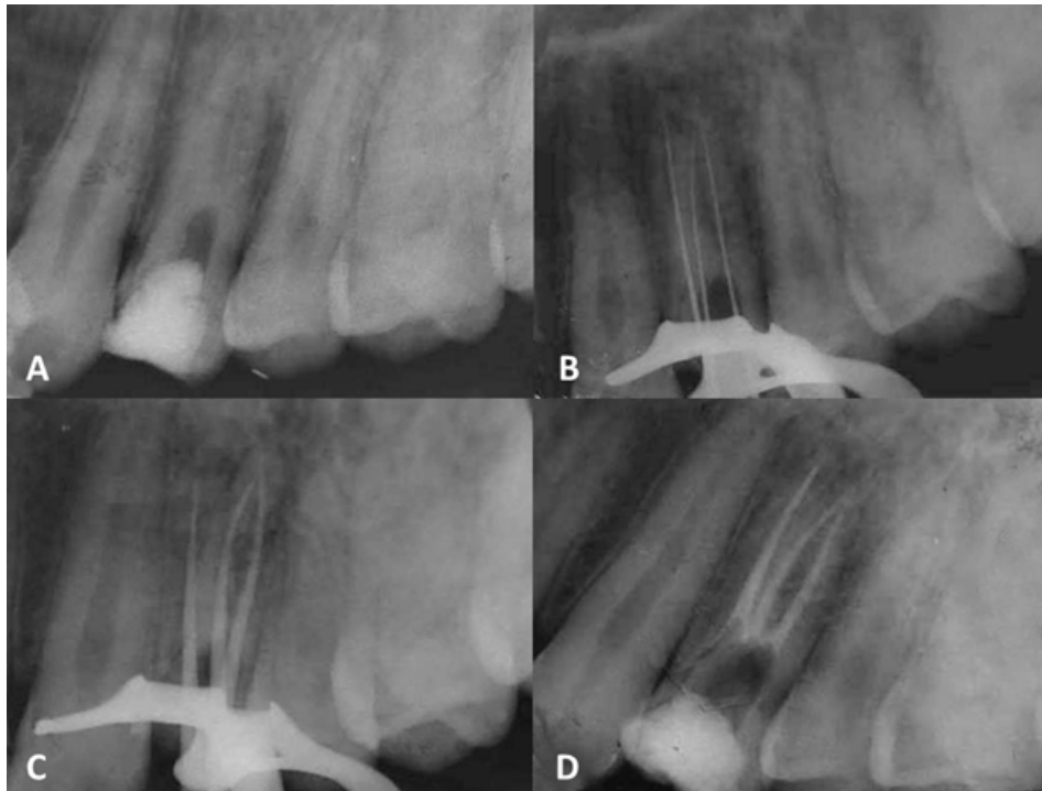
Imagen 2. Secuencia radiográfica. A. radiografía inicial: se observa material provisional en cámara pulpar amplia y anatomía radicular aparentemente compleja; B. odontometría; C. prueba de cono; y D. radiografía final: se observan los tres conductos radiculares obturados

Se modificó el acceso utilizando para este fin una fresa de carburo de bola # 4 y # 2 con vástago largo (JOTA AG, Ruthi-Suiza), con ayuda de la fresa Endo Z (Dentsply Maillefer, Suiza) se regularizó las paredes del acceso. El explorador endodóntico DG16® (Hu-Friedy, Berlín-Alemania) se usó para localizar los tres conductos (mesiovestibular, distovestibular y palatino); Sin embargo, solo el conducto palatino estaba visible clínicamente por lo que con la ayuda de la tomografía computarizada se logró ubicar los conductos mesiovestibular y mesiodistal (Imagen 1).