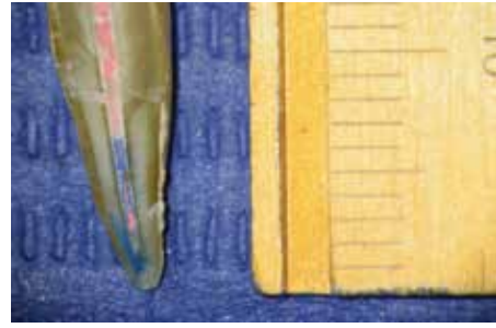
Figura 2. Muestra de microfiltración apical con técnica de obturación de cono único