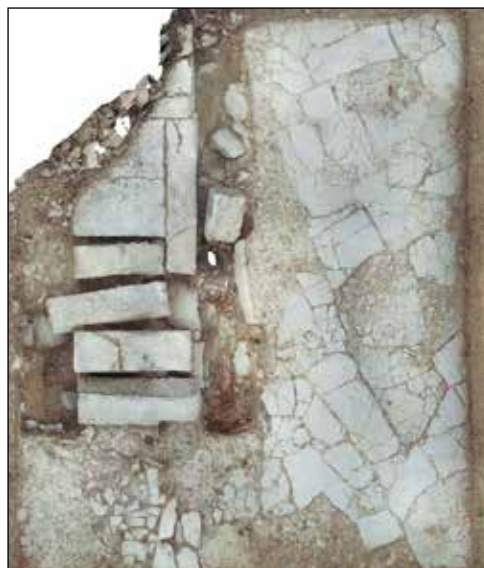
Figura 2. Ortofoto de la planta final del sondeo 1 (procesada con Metashape). Autora: Inmaculada Delage González.

Las tres semanas de intervenciones y los cuatro sondeos practicados apenas nos han permitido atisbar algunos detalles de la articulación del foro de Santa Criz. Han sido