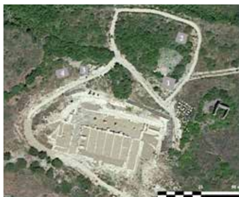
Figura 1. Localización de los sondeos.

El propósito de la intervención arqueológica es conocer cómo se articulaba el forum de la ciudad romana de Santa Criz de Eslava en su plataforma superior. Hasta la presente campaña solo se conocía el sector sur del conjunto, compuesto por un criptopórtico a nivel inferior de la circulación de la plaza (Cebrián et al., 2020, pp. 220-230). Además, en el año 1944, los arqueólogos B. Taracena y L. Vázquez de Parga realizaron una intervención en esta zona que deparó el hallazgo de un monumental paramento de grandes sillares (Taracena & Vázquez de Parga, 1946, p. 427) del que no se conservaba nada en superficie antes del inicio de la presente campaña. Se han realizado cuatro sondeos, ubicados en las prolongaciones hipotéticas –hacia el norte– de los cierres este y oeste del criptopórtico, ya que en estos puntos era más probable encontrar estructuras, según la planta arquitectónica que propusimos recientemente para el conjunto (Cebrián et al., 2020, pp. 236-238).