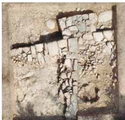
Figura 3. Ortofoto de la planta final del sondeo 2 (procesada con Metashape).