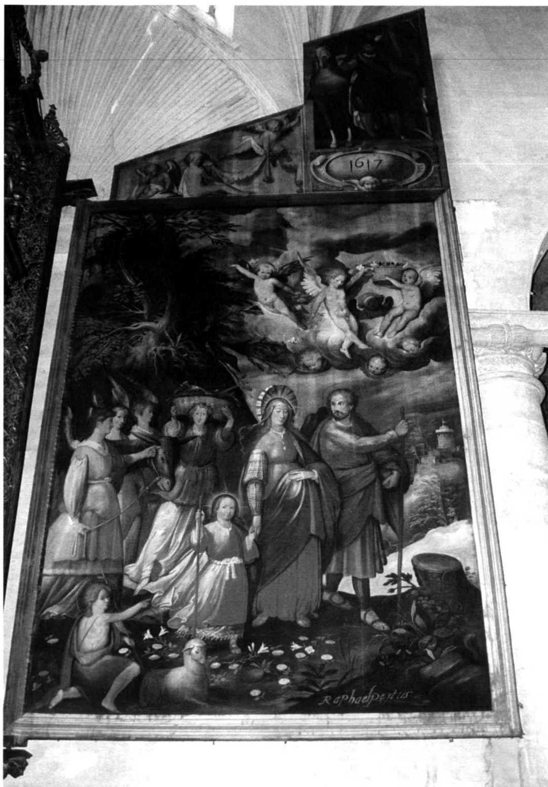
Retorno de Egipto de la Sagrada Familia. Puerta izquierda del Retablo Mayor de la Parroquia de Longares (Zaragoza). Rafael Pertús, 1617.