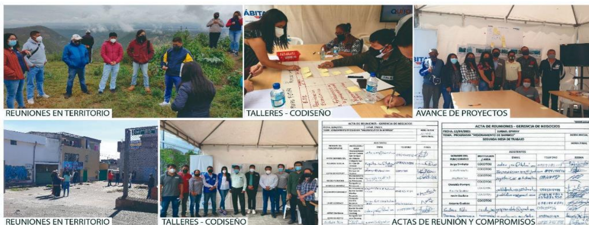
Figura 6. Fotos de procesos participativos.

integralidad de implementación como un solo equipo técnico municipal. Para finalizar las Fase de Socialización, los actores institucionales y el barrio tomarán el reto de continuar las futuras acciones de acuerdo a las competencias administrativas que permitan dar viabilidad a la agenda barrial con los proyectos priorizados (Figura 6).