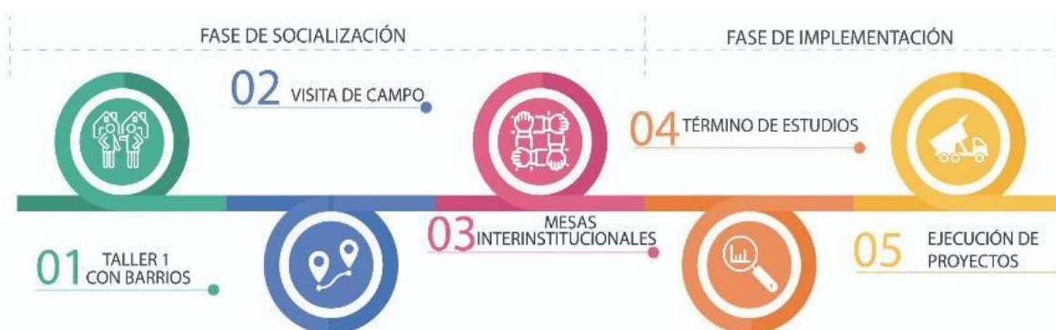
Figura 5. Proceso de Fase Socialización Mejoramiento de barrios.

El Gestor Urbano local plantea la fase de socialización como un proceso de reencuentro entre los actores barriales y sus agendas previas, que alineadas con el programa “Mejoramiento de Barrios” encuentran en la revalorización y actualización de las condiciones, necesidades, actores y prioridades un primer paso para la futura ejecución de sus propuestas; mismas que serán contrastadas en visitas a territorio y en mesas interinstitucionales con otros actores locales para complementar su impacto (Figura 5).