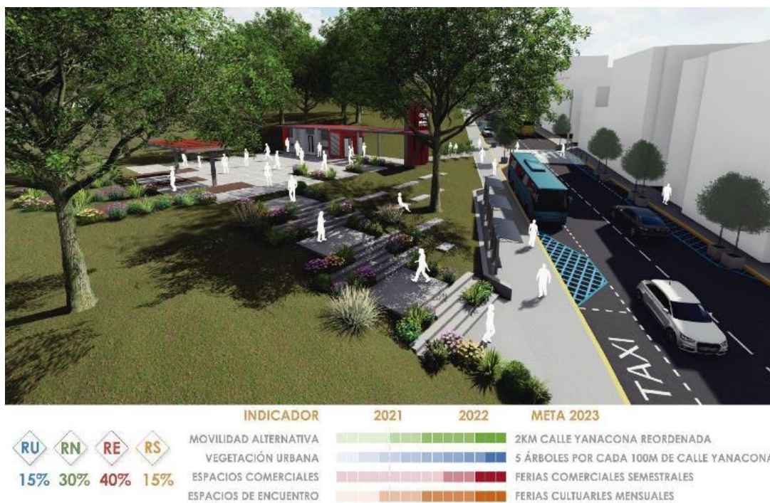
Figura 14. Vista aérea proyecto San Enrique de Velasco.