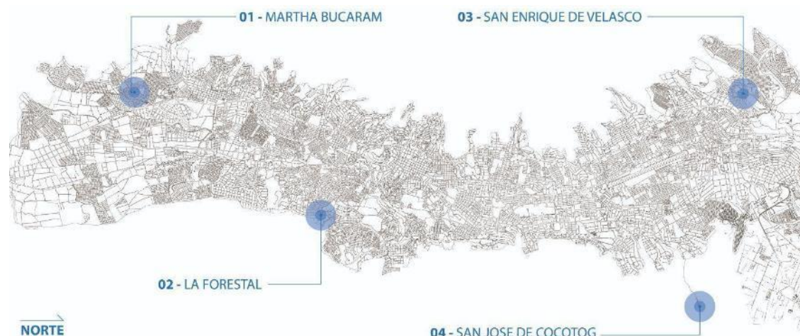
Figura 7. Mapa de ubicación proyectos piloto.