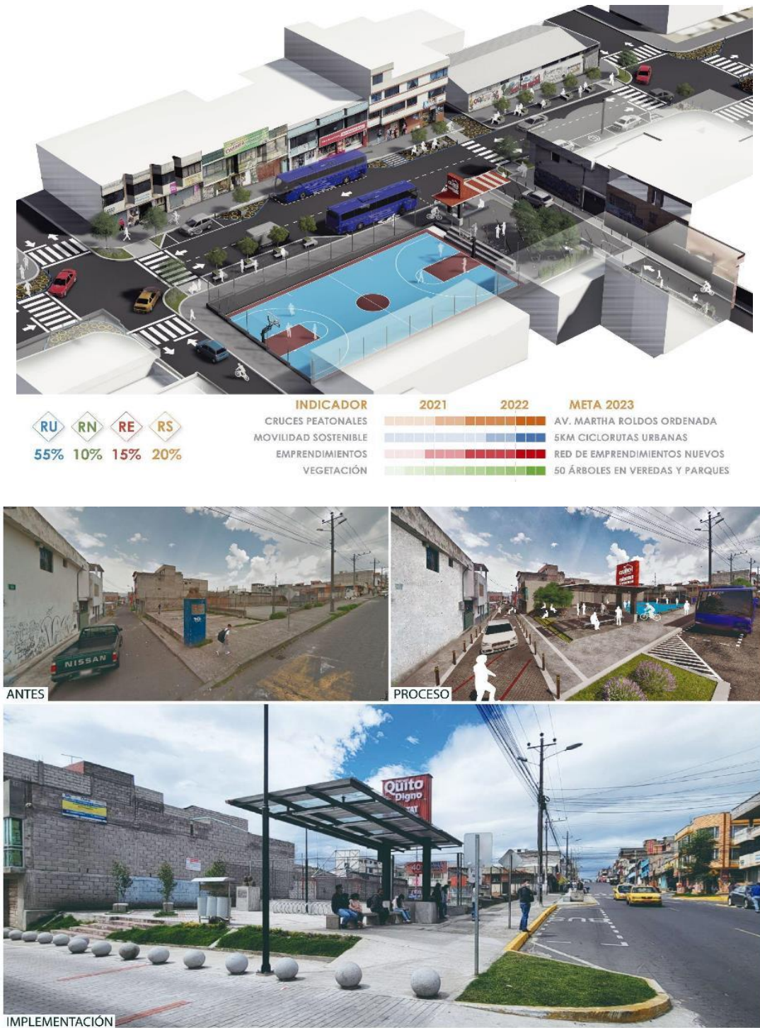
Figura 8 y 9. Isometría general proyecto Martha Bucaram (Sup.). Proceso de implementación Martha Bucaram (Inf.).