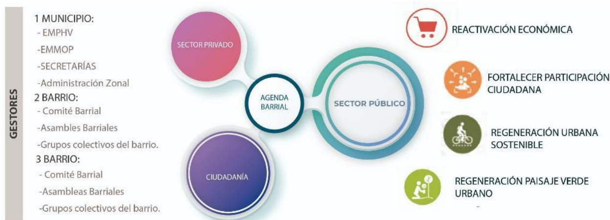
Figura 3. Esquema de componentes de las Agendas Barriales.

Para lograr una adecuada articulación de la agenda barrial con las alineaciones estratégicas enmarcadas en los Objetivos de Desarrollo Sostenible (ODS), la Renovación Urbana y las acciones postpandemia se plantearon los siguientes ejes (Figura 4):