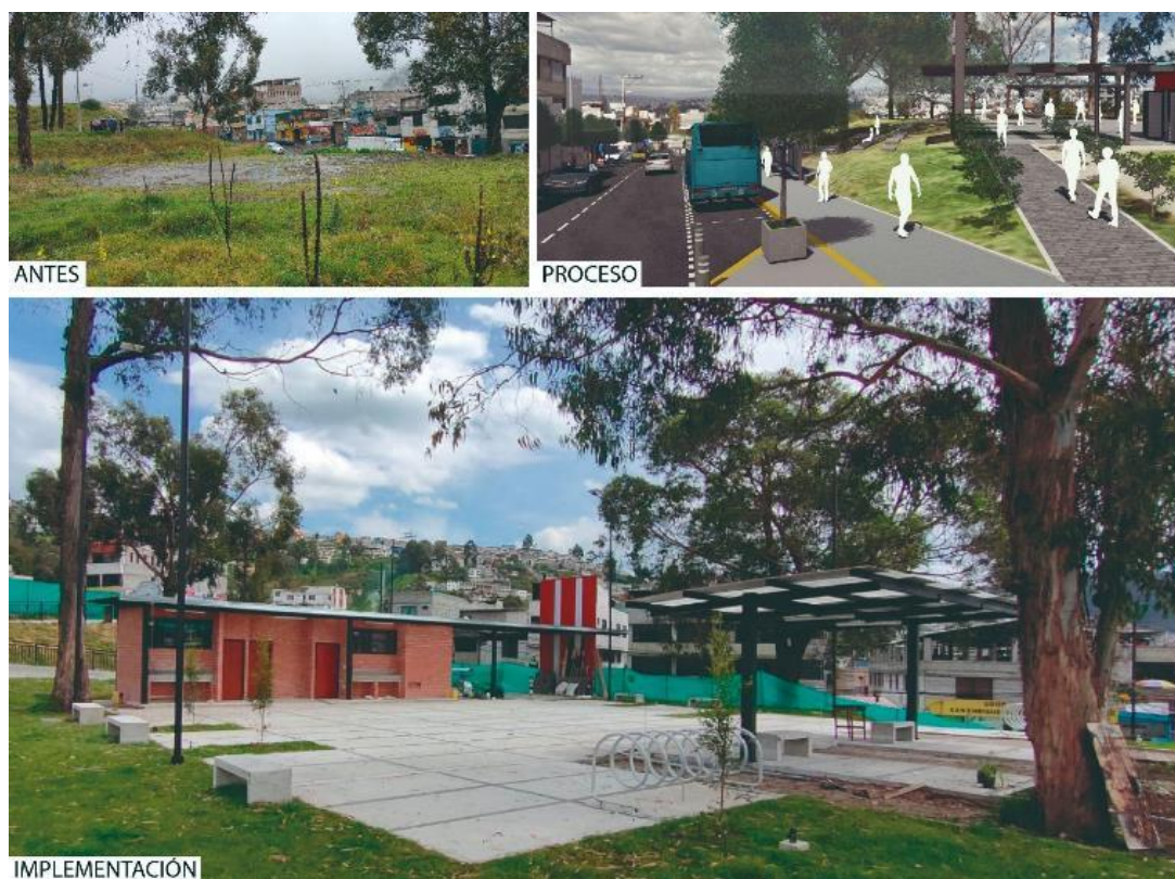
Figura 15. Procesos de implementación proyecto San Enrique Velasco.