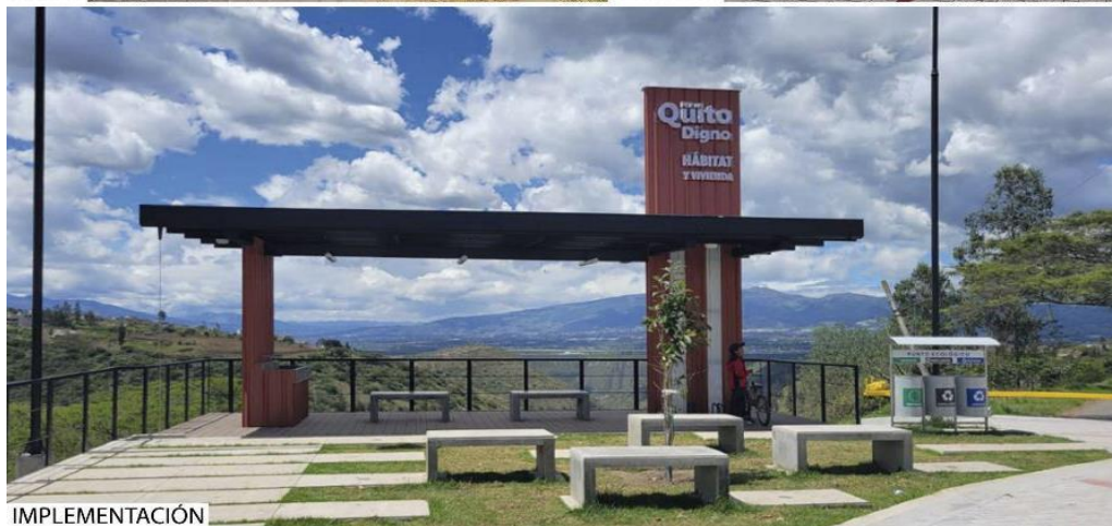
Figura 12 y 13. (Sup.) Vista aérea proyecto San José de Cocotog. Procesos de implementación proyecto de San José de Cocotog. (Inf.)