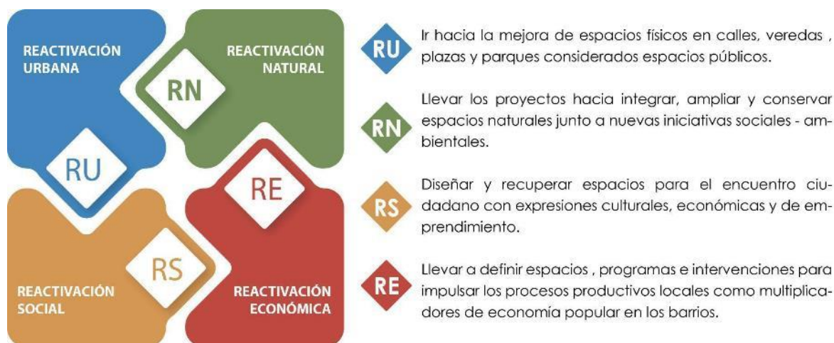
Figura 4. Ejes de reactivación del Mejoramiento de Barrios. Fuente: Elaboración propia.

Para lograr una adecuada articulación de la agenda barrial con las alineaciones estratégicas enmarcadas en los Objetivos de Desarrollo Sostenible (ODS), la Renovación Urbana y las acciones postpandemia se plantearon los siguientes ejes (Figura 4):