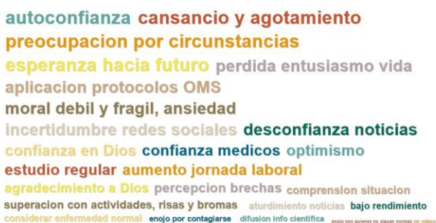
Gráfico 3. Nube de palabras referidos a los códigos por número de Entrevistas.