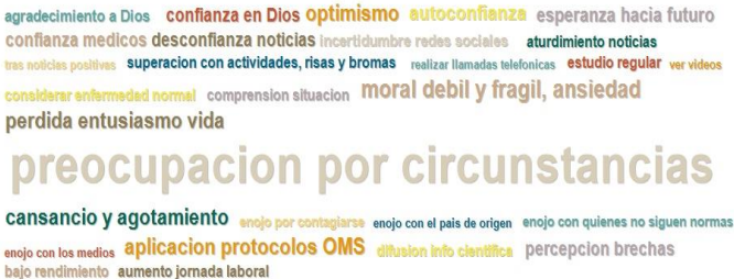
Grafico 2. Nube de Palabras de los Códigos Asociados a temas