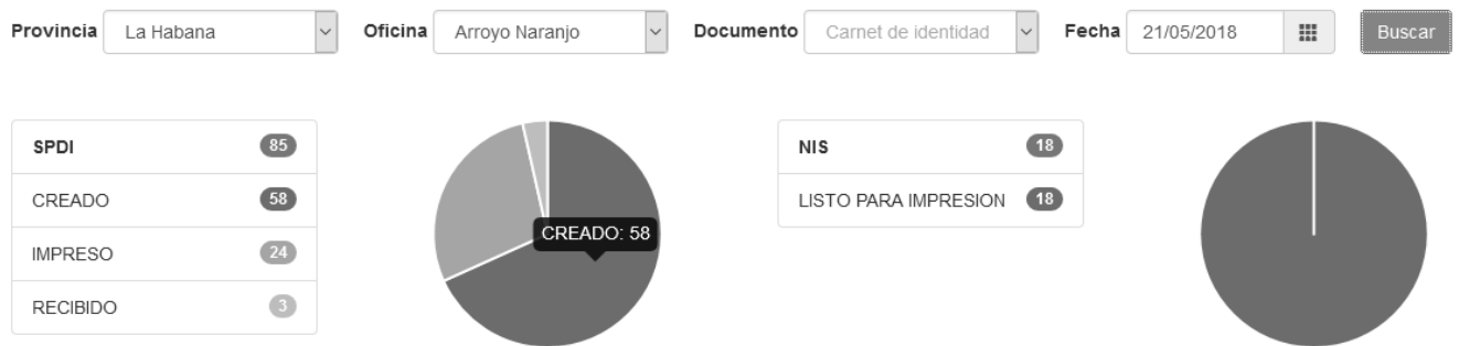
Figura 2. Interfaz: Mostrar estadísticas de los trámites a nivel de oficina