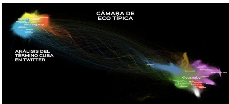
Figura 2. Interacciones sujetos-usuarios de la red formal”

Un 6.46 % de los perfiles encontrados en la investigación no se corresponden con instituciones de Estado, Partido o Gobierno, pero son usuarios institucionales o representan instituciones de la sociedad civil, por ejemplo @AHSCuba o @FEUCLV. El 2.66 % son perfiles institucionales de Centros de Enseñanza Superior como @AlmaCujae o @ISRICuba. El 7.60 % se corresponde con perfil de usuarios de artistas o intelectuales de las ciencias @citaconsilvio o @omartodavia. Un 1.14 % correspondió a empresas o empresarios como @osdegimese institución perteneciente a la Empresa Sideromecánica.