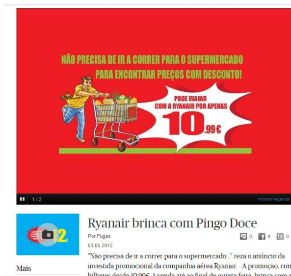
Figura 16 – Repercussões da campanha na publicidade