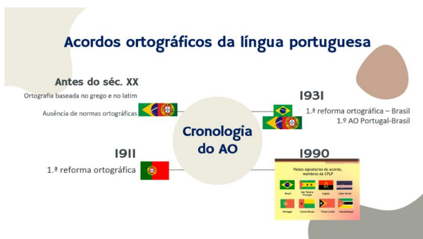
Figura 20 – O acordo ortográfico da língua portuguesa

4. Acordo ortográfico: os alunos são questionados sobre alguns aspetos acerca do acordo como introdução à temática, desde os factos e mitos até às alterações implementadas e a sua aplicação na prática (ou não) em diversos contextos (universidade, governo, meios de comunicação social, etc.).