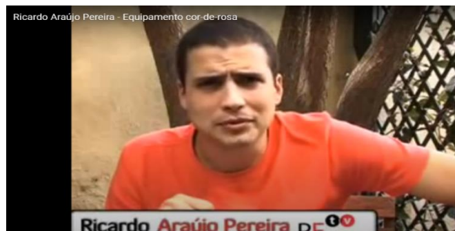
Figura 8 – RAP, “Equipamento cor-de-rosa”

Questão: Quais os argumentos a favor do equipamento cor-de-rosa do Benfica?