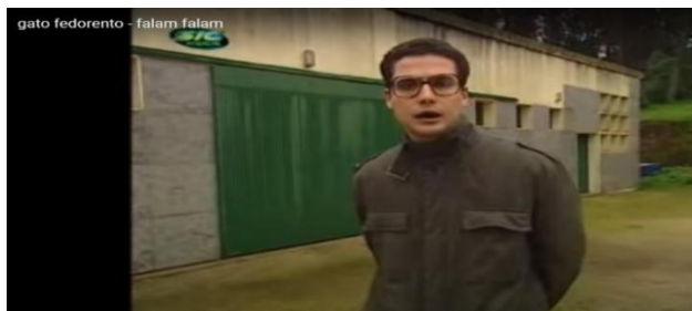
Figura 10 – Gato Fedorento, “O homem a quem parece que aconteceu não sei quê”

Questão: Quem é o alvo de crítica deste sketch ?