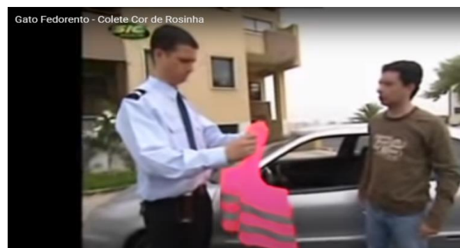
Figura 9 – Gato Fedorento, “Colete cor-de-rosinha”

Questão: Este sketch foi criado para alertar a atenção para a introdução de uma nova lei. Qual? (O objetivo é também estabelecer uma ligação com o vídeo 1)