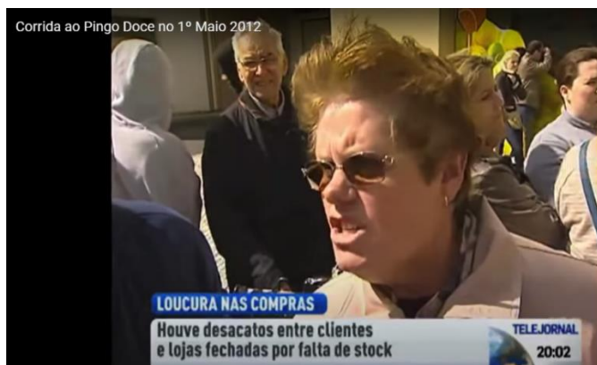
Figura 15 – Consequências da campanha de um hipermercado português na televisão