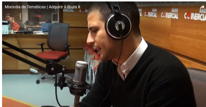
Figura 18 – A continuação da polémica na rádio um ano depois

Fonte: Mixórdia de Temáticas | Adquirir à Bruta II (2013)