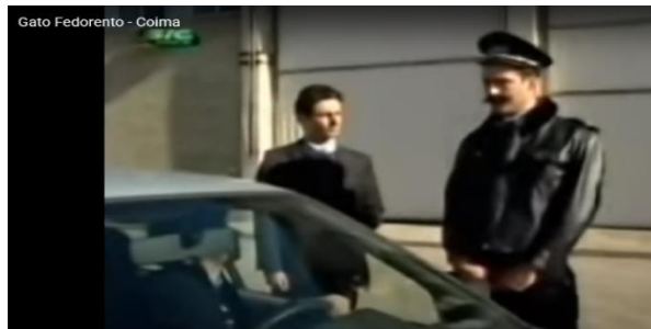
Figura 12 – Gato Fedorento, “Coima”

1. Assistir à primeira parte do sketch (até 1:26).