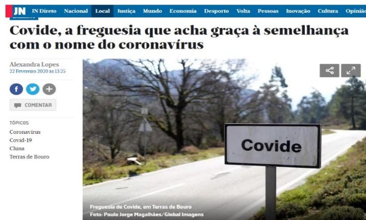
Figura 14 – Imagem de topónimo português inusitado