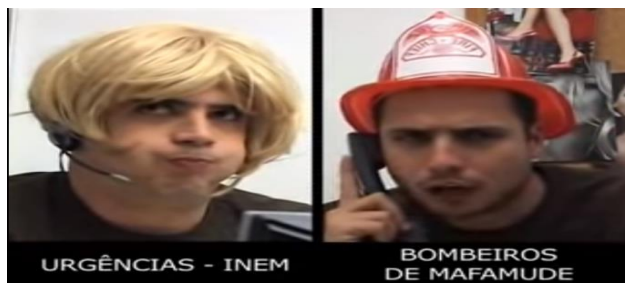
Figura 11 – RAP, “Hotline (INEM - Bombeiros de Mafamude)”

Fonte: RAP, “Hotline (INEM - Bombeiros de Mafamude)” (2008)