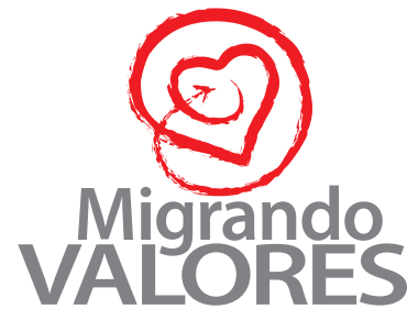
Figura 1. Logotipo Migrando valores.

La idea es que el nombre sirva además como paraguas de varios proyectos relacionados con la difusión de estos valores. Los símbolos que se utilizan para entender el concepto son el corazón, como representación del sentimiento o kimochi ; las formas circulares, que representan el paso del tiempo; la proyección hacia el futuro, que regresa a los conocimientos antiguos, y el color rojo, que representa ambas nacionalidades como elemento común (véase figura 1).