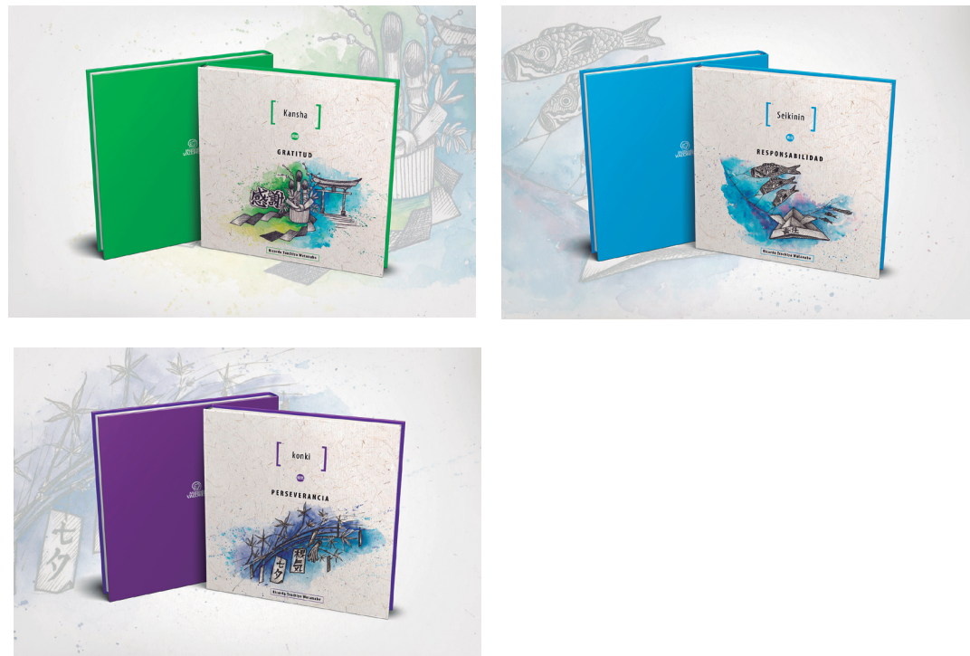
Figura 2. Piezas editoriales, crónicas ilustradas.

Cada crónica ilustrada también incluye una plantilla y las piezas para armar un paper toy que representa a un objeto característico de la festividad central de la crónica, con el objetivo de que, al terminar la lectura, el padre o la madre de familia interactúe con el hijo en el armado del paper toy , de tal forma que la acción del armado y la exposición del objeto en algún lugar de la casa permitan relacionar la festividad con el valor a interiorizar. De esta manera, padres e hijos compartirán tiempo juntos, aprenderán sobre una festividad de la tradición japonesa e interiorizarán un valor de manera lúdica y en un ambiente familiar (véase figura 3).