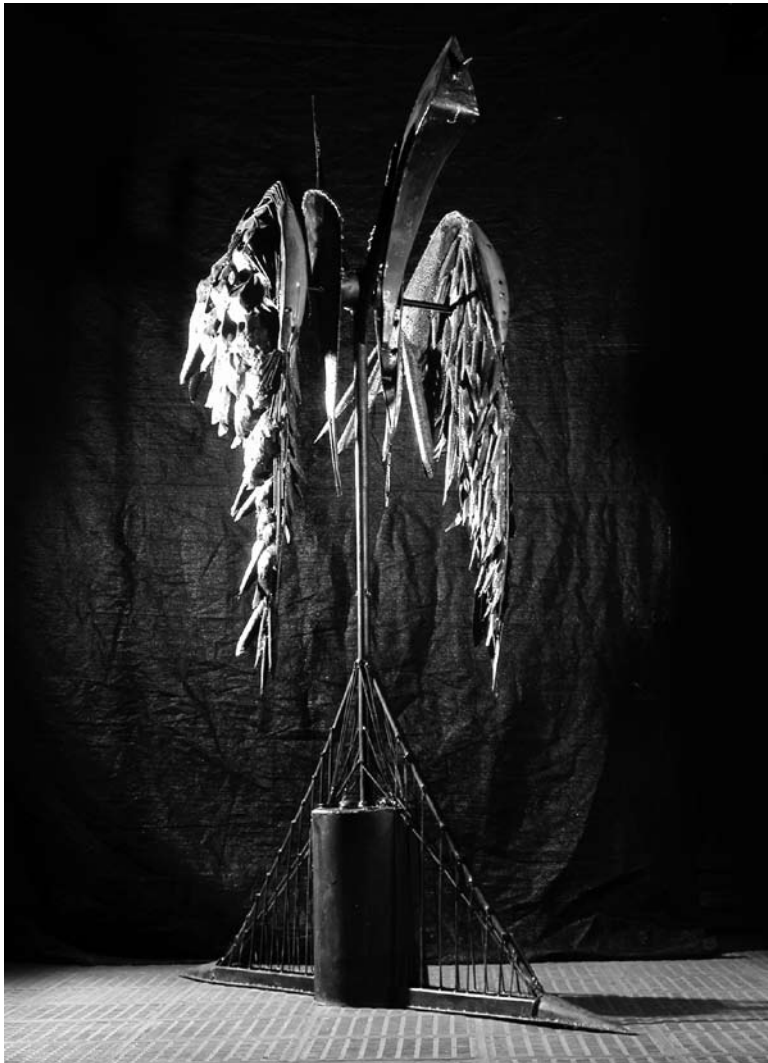
"La fuga de Wailand. Mitoescultura", hierro forjado y soldado. Rubén Schaap

Fecha de Aceptación: 18 de diciembre de 2013