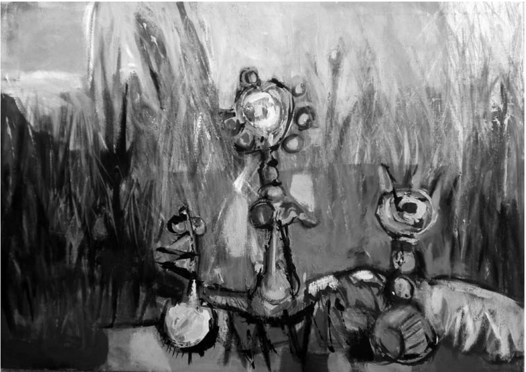
"Se vuelve flor" , acrílico sobre tela. Noemí Fiscella