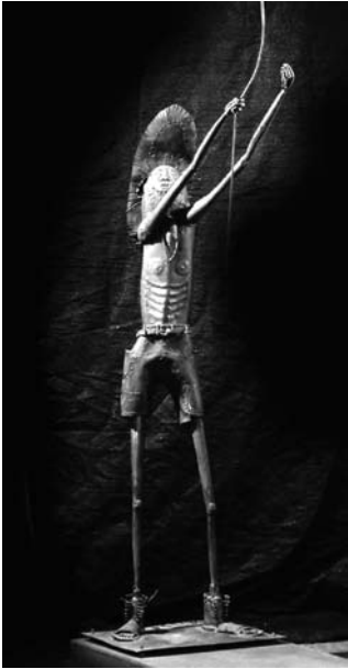
Detalle "Juanito Laguna disfrazado obsequia un barrilete a Berni", hierro reciclado y soldado. Ruben Schaap