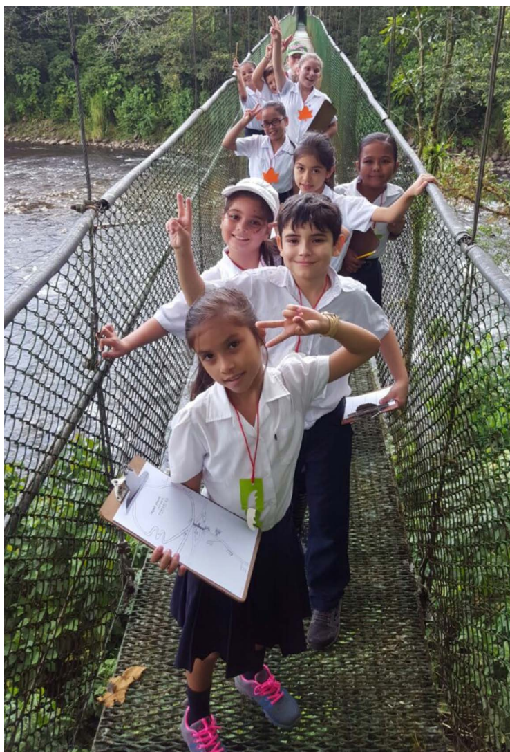
Figura 3. Estudiantes de una escuela pública de Sarapiquí participando en el programa de educación ambiental Aula en el bosque , en 2019.

En Tirimbina, como parte de la evaluación del programa Aula en el bosque , durante el año 2019 se realizaron encuestas a docentes y estudiantes, además de solicitarles a la niñez participante escribir una carta con la narración de su experiencia en Tirimbina, dirigida a personas que no