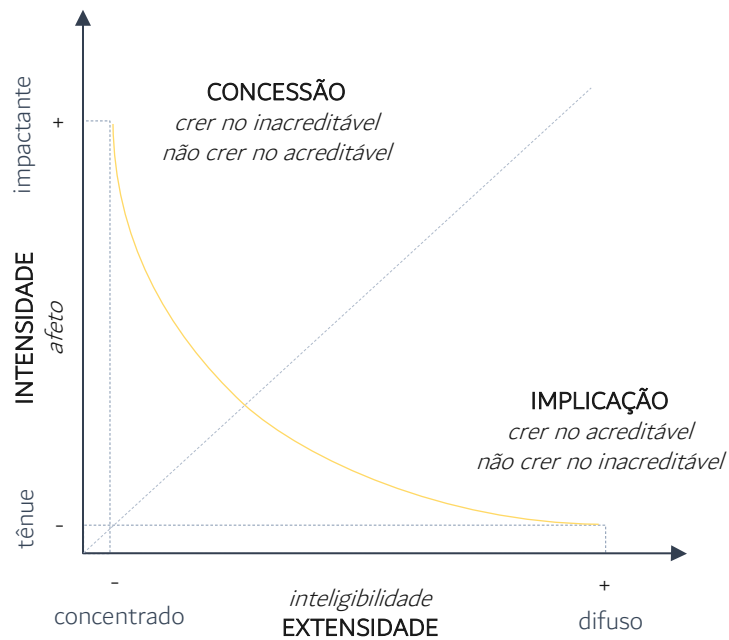
Figura 2: Configuração tensiva dos sintagmas elementares da crença.