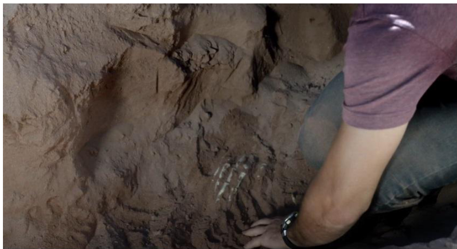
Figura 1: Romance policial (Jorge Durán, 2015)