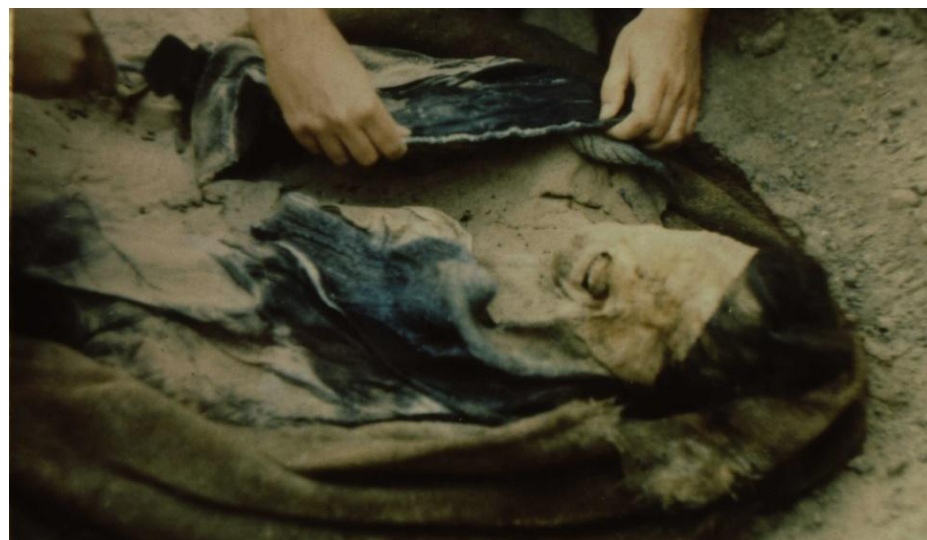
Figura 2: Exhumación en Pisagua, 1990