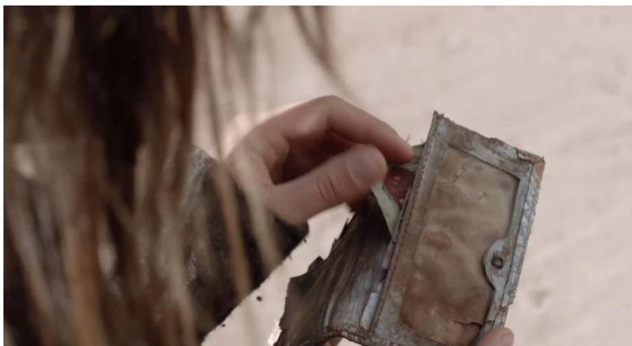
Figura 4: Romance policial (Jorge Durán, 2015)