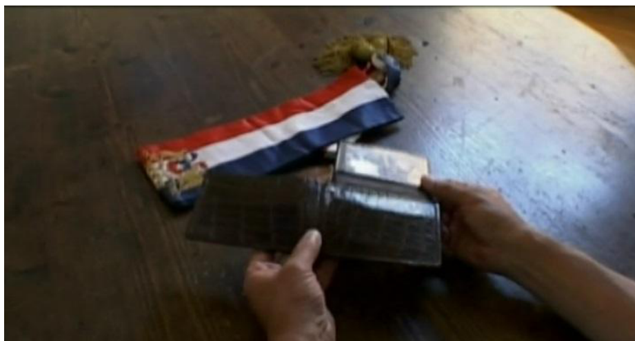
Figura 3: Salvador Allende (Patricio Guzmán, 2004)