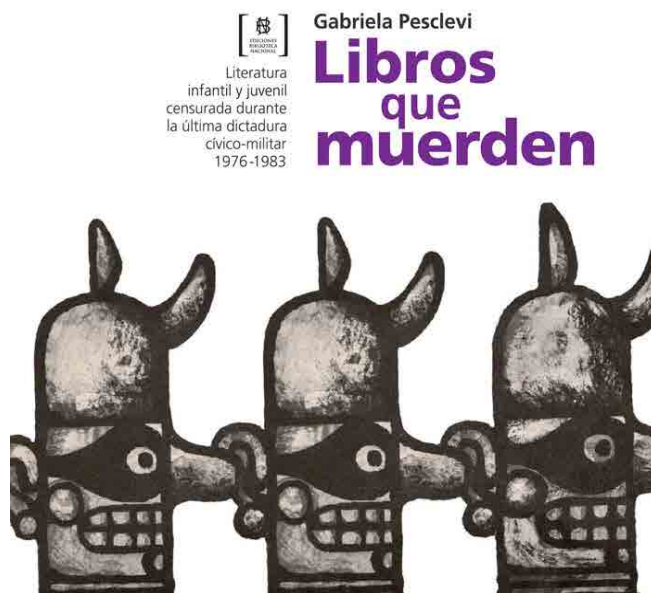
Figura 3: Programa Libros que muerden

A través de una colección de literatura heterogénea y diversa, la comprensión de la memoria de la violencia política puede ser abordada, el reconocimiento de la función social de las LEO en una experiencia como esta está completamente viva y a disposición no solo de la sociedad argentina sino del mundo entero, pues el lenguaje como artilugio compartido permite acercarnos al horror de la guerra, de la violencia, para concientizarnos de que otras formas de organización social son posibles.