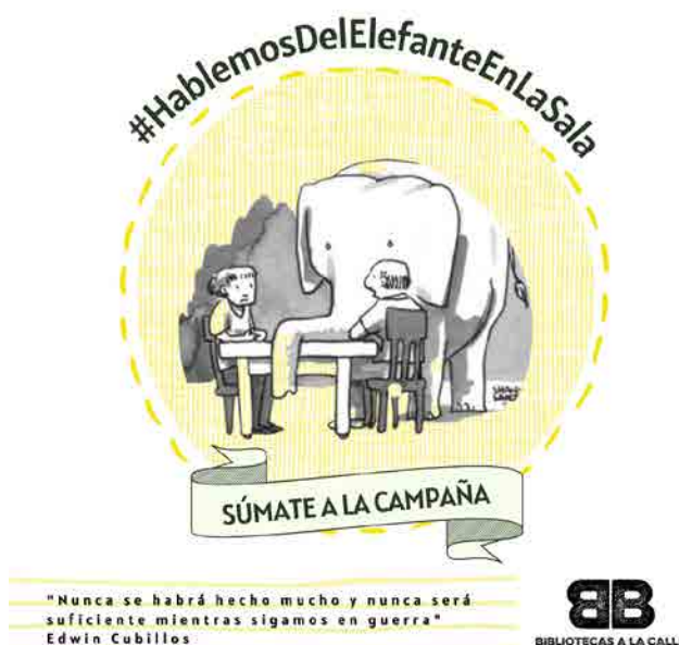
Figura 4: Programa del Elefante en Sala

Esta campaña ha congregado la palabra en múltiples formas y formatos y ha presentado alternativas para hablar de lo innombrable mediante el arte y la literatura. La intención de la campaña del Colectivo Bibliotecas es aportar al cuidado y defensa de bienes colectivos como la cultura y la educación a través del conocimiento de hechos sociales que parecen pasar desapercibidos pero que realmente se presentan socialmente y evadimos de manera constante.