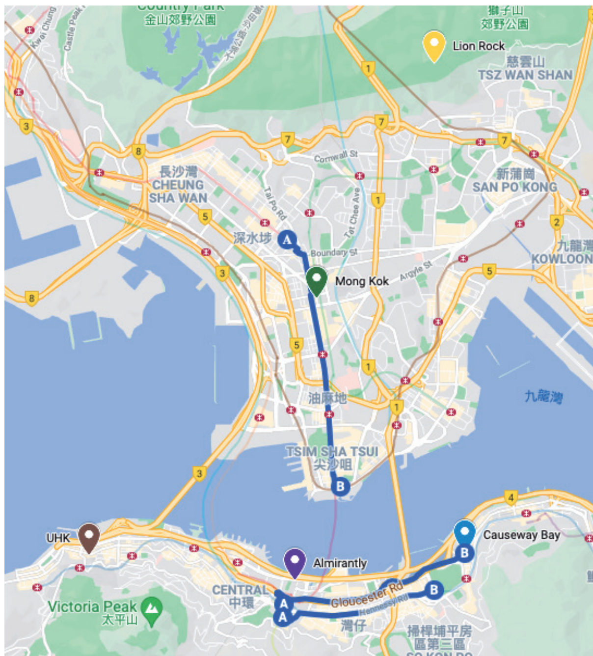
Figura 1 - Principales puntos de protesta en Hong Kong en 2014