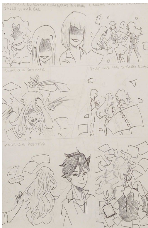
Figura 1: História desenvolvida pelos alunos sobre política