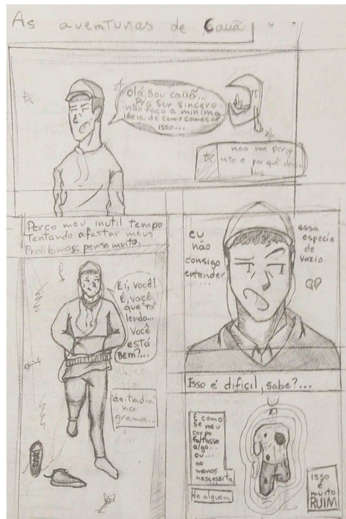
PhotoScan do Google Fotos