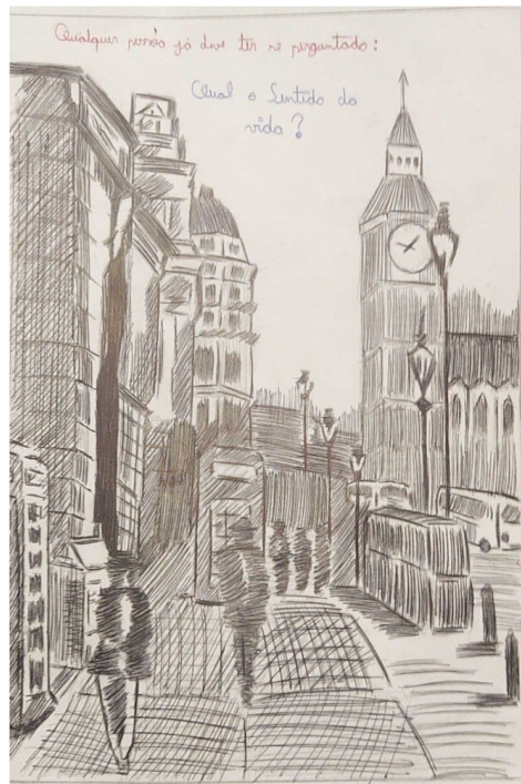
PhotoScan do Google Fotos