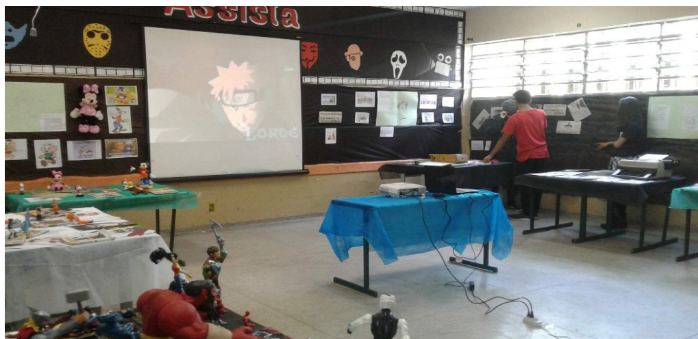
Figura 5: Exposição dos trabalhos produzidos na disciplina Filosofando em Quadrinhos

Ao todo, foram 30 aulas da eletiva, com início em março e término e apresentação final (culminância) – aberta a toda a escola e comunidade – em junho. Responsáveis pela organização do evento, os estudantes decidiram preparar uma exposição (Figura 5), na qual apresentaram seus próprios desenhos e os conhecimentos obtidos ao longo do processo. Salienta-se que não houve verba escolar para o projeto e que alunos e professores trouxeram todos os materiais voluntariamente.