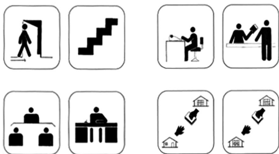
ZONAS PELIGRO Y SALIDA . FIG. VIII (49-56)