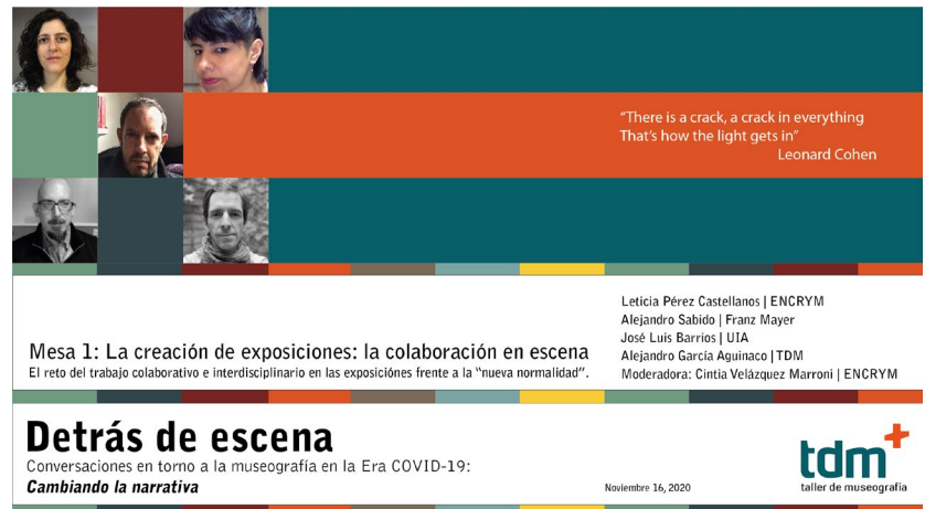
FIGURA 1. Presentación de la mesa 1 (Gráfico: Alejandro García Aguinaco).

Dos preguntas sirvieron como detonantes del conversatorio. De la primera (¿cuáles han sido los efectos de la pandemia en la práctica museológica y museográfica?) cabe destacar cómo aquella exacerbó y sacó a la luz problemas que estaban ahí: jerarquías implícitas, carencia de un lenguaje común entre los especialistas y los técnicos, problemas estructurales que revelan una falta de definición de políticas en los diversos ámbitos de acción del museo, lo cual provoca malas prácticas, con un modus operandi reactivo y dinámicas organizacionales rígidas, aunados a una precariedad laboral y económica inviable.