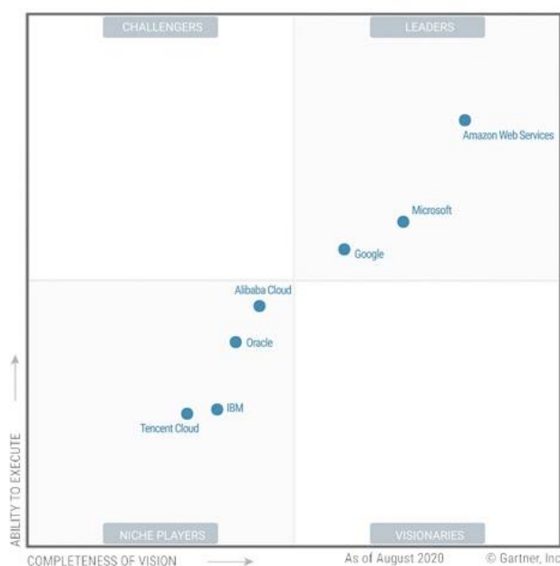
Figura 2: Cuadrante mágico de Gartner para Infraestructura como servicio.