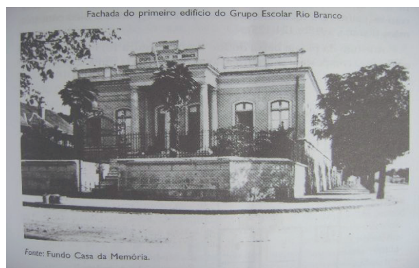
Figura 1. Fachada do primeiro edifício do Grupo Escolar Rio Branco. Foto BENCOSTTA, Marcus L. A. 2005a.

As técnicas adotadas na construção do projeto arquitetônico de Bottiechia foram semelhantes às empregadas em todos os outros edifícios-escola, ou seja, alvenaria de tijolos de barro, janelas constituídas com caxilhos de cedro, vidro e venezianas, forros, assoalhos de pinho, assim como o madeiramento do telhado, cobertura de telhas francesas, fundação direta de alvenaria de pedras, revestimento com argamassas de cal e areia e, por fim, a pintura do edifício, sendo as paredes a cola com requadros e o madeiramento das janelas e portas a óleo com três mãos [...].