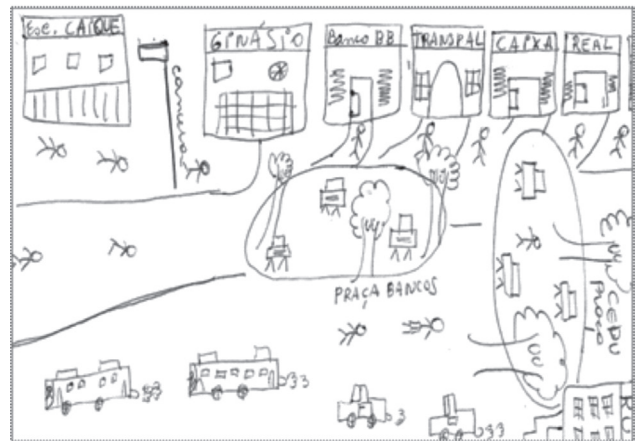
Mapa mental 5: Os elementos da paisagem

Retirando um fragmento do mapa mental do aluno 03, observaram-se fortemente os elementos da natureza, representados pelas árvores. Também a paisagem construída através dos prédios, os elementos móveis carros e ônibus e o elemento humano indicando a circulação de pessoas.