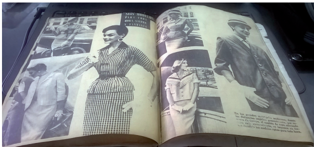
Imagen 1: Seis modelos para toda hora. Sastré y fantasía.

a continuación podemos apreciar 6 páginas destinadas a la sección Modas, la que más páginas posee dentro de la publicación. Se trata de un apartado repleto de fotografías de mujeres mundanas, elegantes, modernas e insertas en el mercado laboral. Allí se exhiben, con sus modelos correspondientes, seis modelos para toda hora: sastré y fantasía.