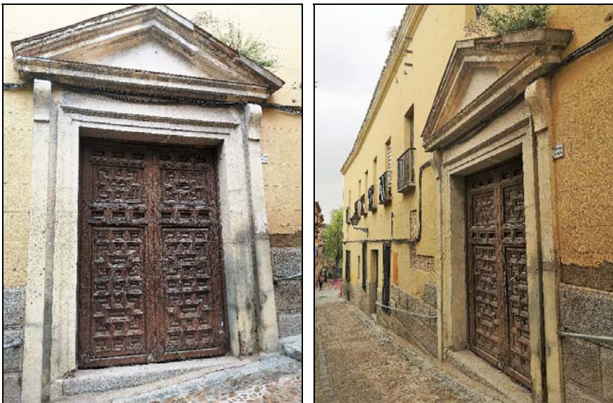
4. Antigua Capilla del Corpus Christi fundada 1567. Portada y fachada de la Iglesia. Finales de s. XVIII. Posible obra de Ignacio Haan.