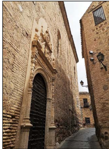
3. Convento de san Clemente. Portada y fachada de la Iglesia conventual. Alonso de Covarrubias. 1534. Obra maestra del plateresco.