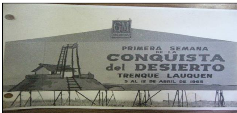
Caja SNCD 1965 a 1968