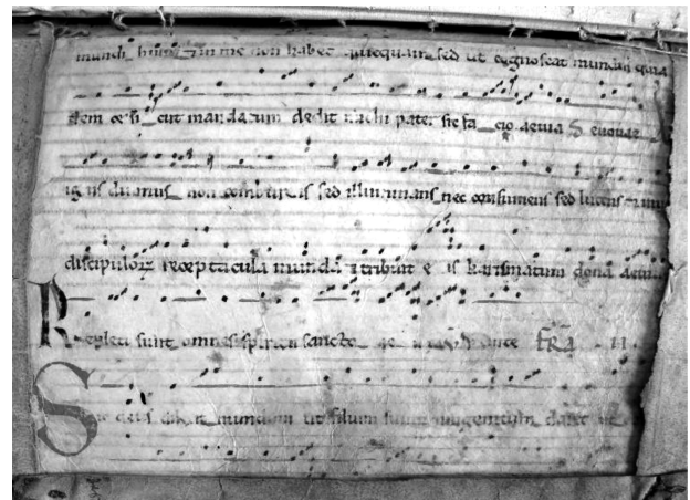
Fig.4. Golmés. Manual Notarial (1624-1628).

Un altre volum notarial mesura 225 x 165 mm, amb les tapes de pergamí que correspondria a un volum petit, un llibre petit de faristol del segle XIV [?]. 25 El manuscrit musical presenta un pentagrama on la