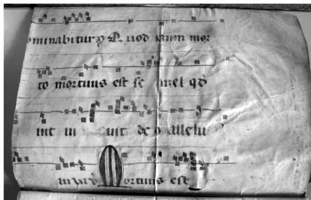
Fig.1. Castellnou de Seana. Baptismes (1667-1682) (autor).

El tercer manuscrit es troba com a tapes del quart volum de baptismes. 5 El volum mesura 217 x 164 mm. La cara exterior es presenta deteriorada pel fregament i la claror, en canvi la interior es troba en més bon estat. El manuscrit correspondria a un volum gran de faristol, molt probablement del segle XIV. El document està escrit en tetragrama i en algun moment, per la necessitat d'ubicar els neumes musicals, passa a pentagrama. Les línies es mostren en vermelló la primera i la cinquena, mentre que la segona i la quarta es presenten en sec i la tercera en groc. En aquest cas la partitura conté els custos al final de les línies. Tal i com està recosit no s'hi poden identificar les claus però la línia vermella correspondria a la clau de Fa. La notació és quadrada i romboïdal. En la cara interna del còdex es troba el cant per al Diumenge de Resurrecció Mortuus est propter delicta nostra et resurrexit propter iustificaciones nostras (fig.1).