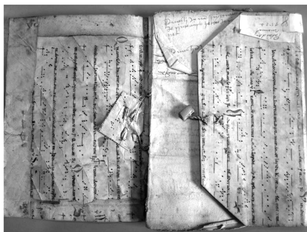
Fig.5. El Palau d'Anglesola. Manual Notarial (1526-1527).

El segon manual notarial del Palau d'Anglesola mesura 222 x 158 mm, 30 i el pergamí que li fa de tapes pertanyia a un llibre petit de faristol del segle XV [?]. Els cants es troben escrits en tetragrama en vermelló i la clau de Fa en la segona línia i posteriorment en la quarta, en groc la clau de Do. Quan apareix la cinquena línia la clau de Fa passa a la quarta línia. La notació és quadrada. Es desconeix la festivitat en què es cantava. En la cara exterior s'identifica Numquid dominus supplantat iudicium aut omnipotens subvertit quod justum est libera me domine et pone me juxta te et cuiusvis manus pugnet contra me , i Quis det ut veniat ad 31 peticio mea, et quod expecto tribuat michi. Nisi tu . En la cara interior es troben les lamentacions Qui consolabatur me recessit a me quæro quod volui et non invenio fundunt oculi mei lacrimas quia repletus sum amaritudine . També s'hi troba Fletum deduxerunt oculi mei et palpebre Meas operuit umbra mortis (fig.5 i 6).