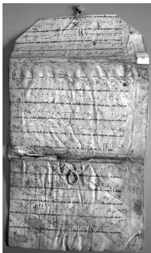
Fig.6. El Palau d'Anglesola. Manual Notarial (1526-1527).