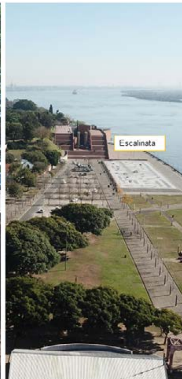
Figura 4. Fotografías que permiten ilustrar la rampa interrumpida adyacente a la escalinata que absorbe la barranca entre los sectores norte y sur del Parques España.