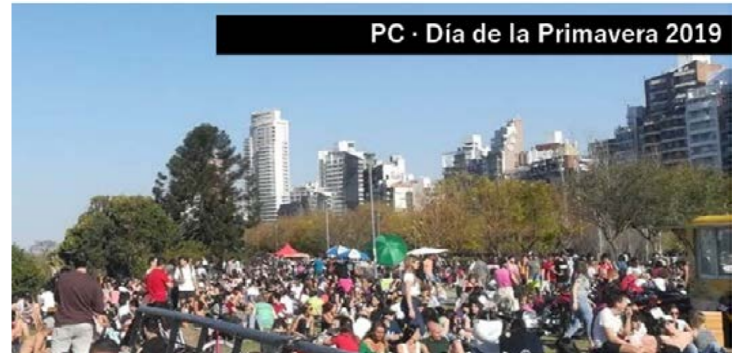
Figura 5. Fotografía que muestra la apropiación de la barranca por fuera de los límites del PC y la mencionada baranda.

En segundo lugar, en un mundo mayormente urbanizado, el espacio público recreativo cobra un rol central para el bienestar desde múltiples dimensiones, que se potenciaron en tiempos de Covid-19. Estudiar la lógica subyacente bajo la que se proyectan estos