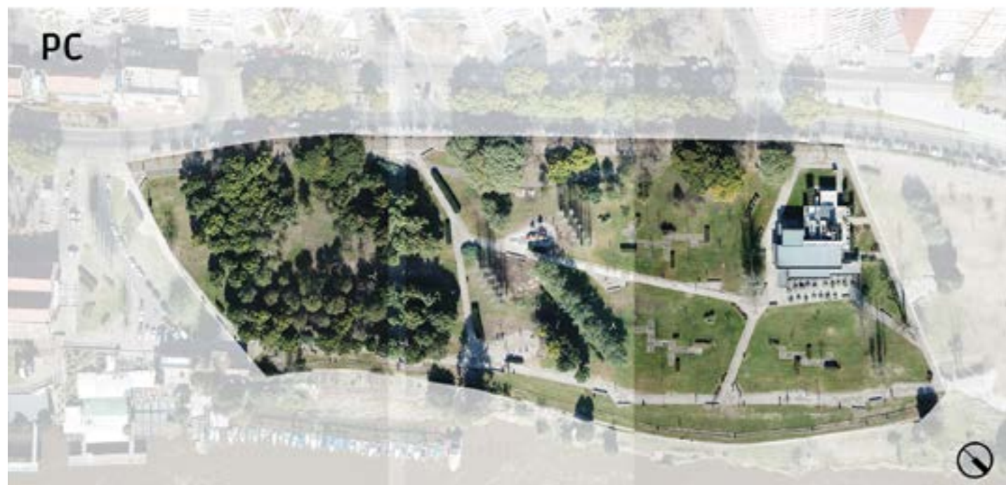
Figura 3. Vista aérea de los sectores de parque analizados. Imágenes tomadas con drones como parte de las actividades de investigación. (Arriba) Parque España Sur (PES). (Abajo) Parque de las Colectividades (PC).

vio favorecido al contar con mayor cantidad de árboles y vegetación que el PES (Figura 3).