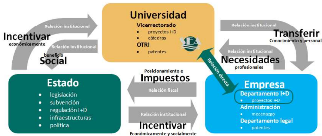
Fig.1. Papel desempeñado por del grupo SEA en el contexto de la colaboración Universidad, Estado y empresa.

relaciones entre los agentes implicados en la colaboración U-E. Así, las relaciones pueden llegar a ser más directas y flexibles en la consecución de los objetivos estratégicos, construyendo así un escenario de cooperación centrado en la relación entre el sector académico y privado (siempre en el contexto impuesto por el Estado), que permita desarrollar tanto la transferencia del conocimiento, como la formación integral del alumno (Fig. 1).