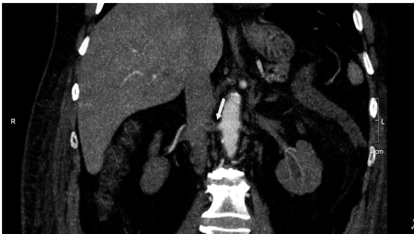
Imagen 2. Angiotomografía renal con contraste endovenoso, corte coronal. Defecto en la opacificación de la arteria renal derecha con reperfusión distal. Hallazgo compatible con trombosis aguda.