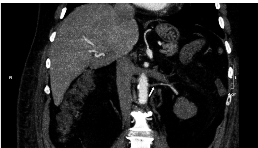
Imagen 3. Angiotomografía renal con contraste endovenoso, corte coronal. En riñón izquierdo se visualiza variante anatómica correspondiente a arteria polar renal, con defecto en la opacificación proximal y reperfusión distal. Hallazgo compatible con trombosis aguda.