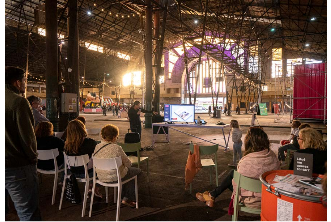
figura 7 Modelo Abierto Nacho Correa