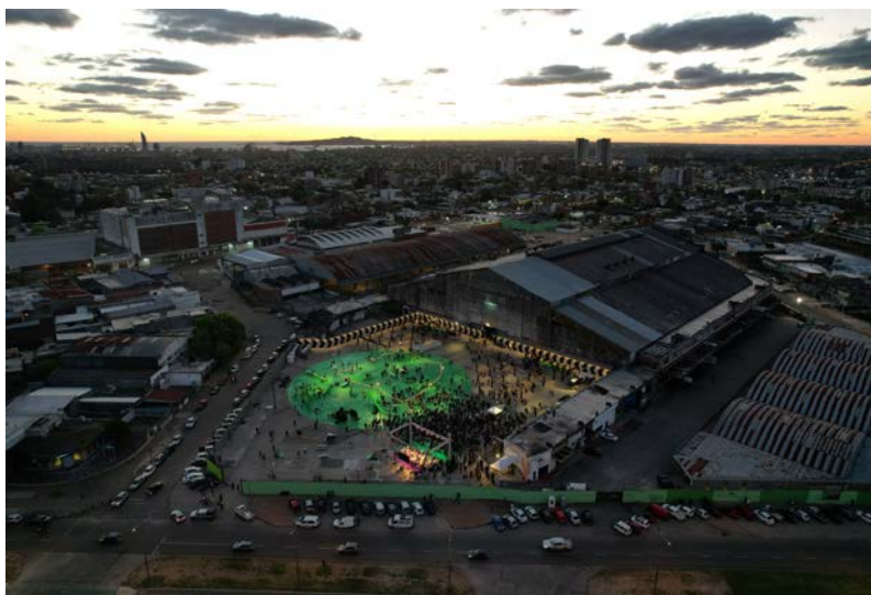
figura 4 Modelo Abierto Valentín del Río MVD LAB IM

Despojados de uso, ya obsoletos para la función que han sido diseñados, en prácticamente cualquier ciudad del mundo aparecen los cadáveres de edificios e infraestructuras urbanas en descomposición. Acechados por el ansia neoliberal, dispuesta a sacrificar cualquier construcción singular en aras de una experiencia urbana totalmente genérica, y codiciados por su posición dentro del tejido urbano, estos edificios suelen ser víctimas de una segunda vida a través de la gestión privada: experiencias gourmet, centros comerciales o fallidas fundaciones culturales. Cualquier proyecto con un plan de negocio que aligere las obligaciones municipales para un patrimonio arquitectónico no siempre reconocido será bienvenido. Este podría ser, perfectamente, el destino soñado por más de una promotora inmobiliaria del Mercado Modelo en la ciudad de Montevideo.