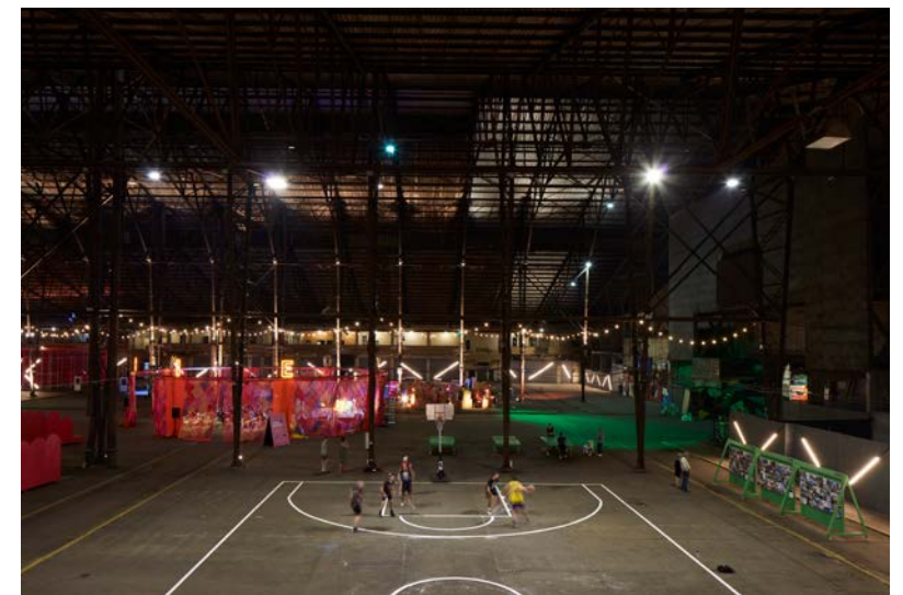
figura 12 Modelo Abierto Aldo Lanzi