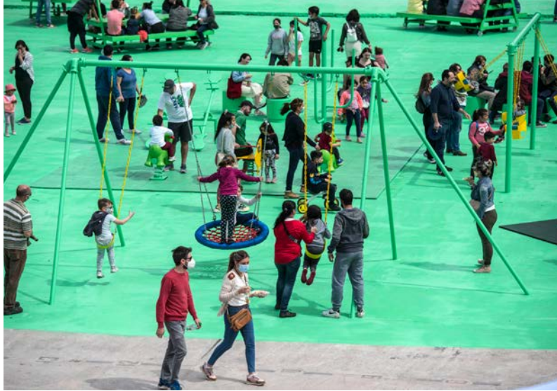
figura 2 Modelo Abierto Comunicación IM