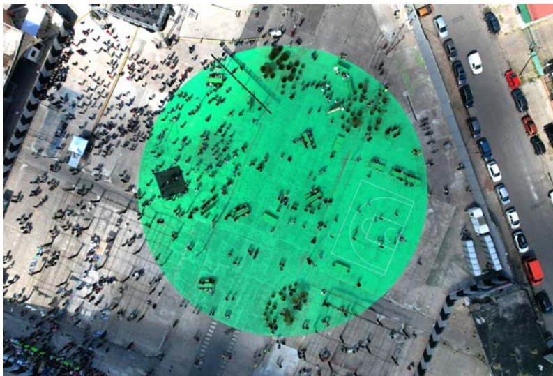
figura 3 Modelo Abierto Comunicación IM