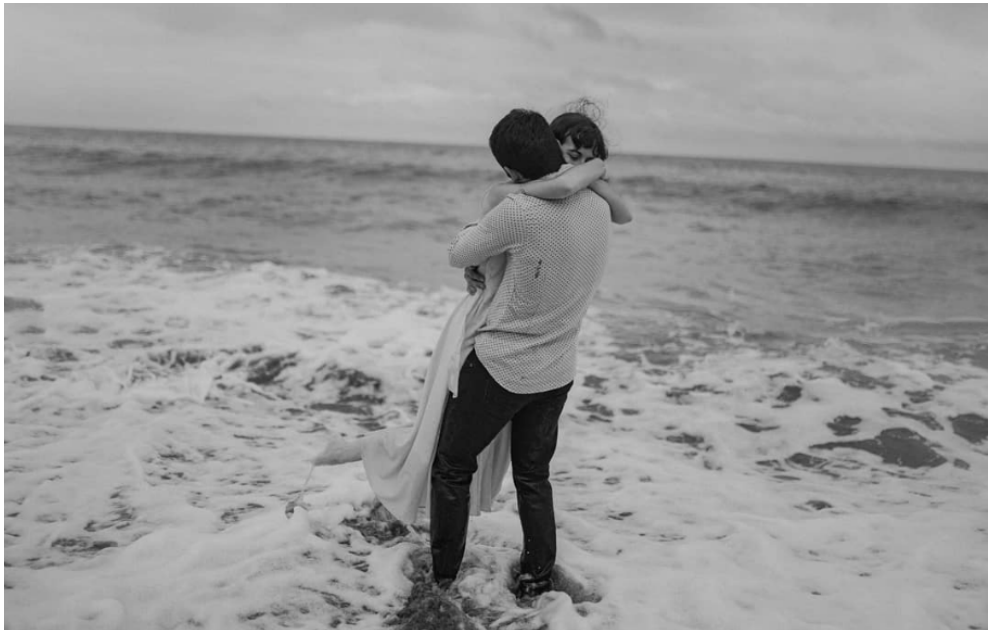
Figura 5. Fotografía compartida por Olatz Vázquez en su perfil de Instagram el 11 de agosto de 2020.