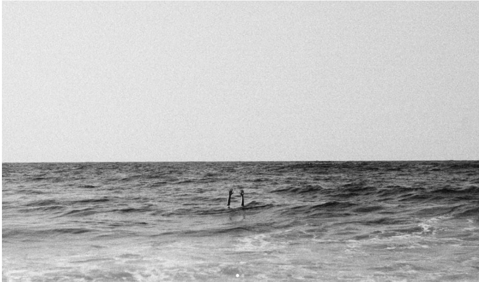
Figura 2. Fotografía compartida por Olatz Vázquez en su perfil de Instagram el 12 de julio de 2020.

El ruido de la imagen y su fuerte contraste convierten el mar en una alegoría del cáncer, una amenaza que ahoga. Así, apunta no solo a la dificultad de superar el diagnóstico, sino a la tormenta que se avecina con el tratamiento y al cambio que anticipa en su vida.